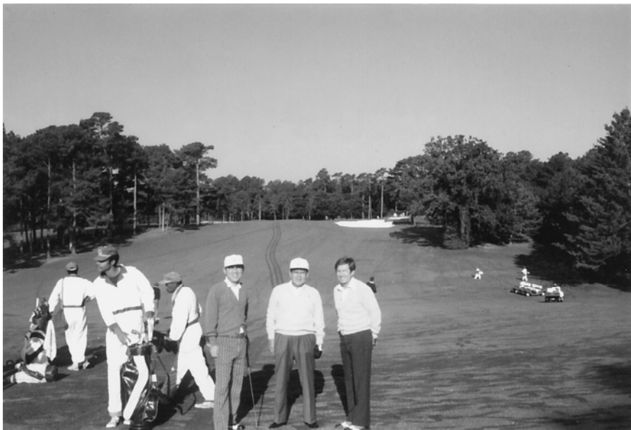
オーガスタゴルフクラブでの近影（左）