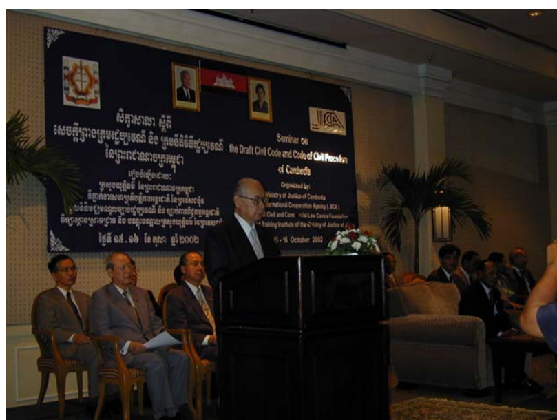
総括スピーチを行う三ヶ月元法務大臣