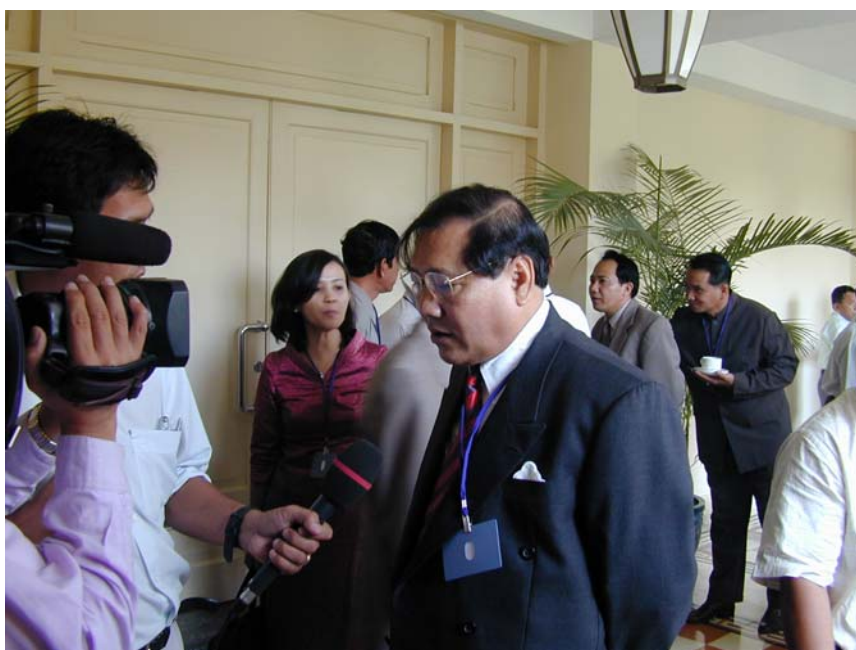
記念セミナーの様子は現地TVニュースでも放映された。