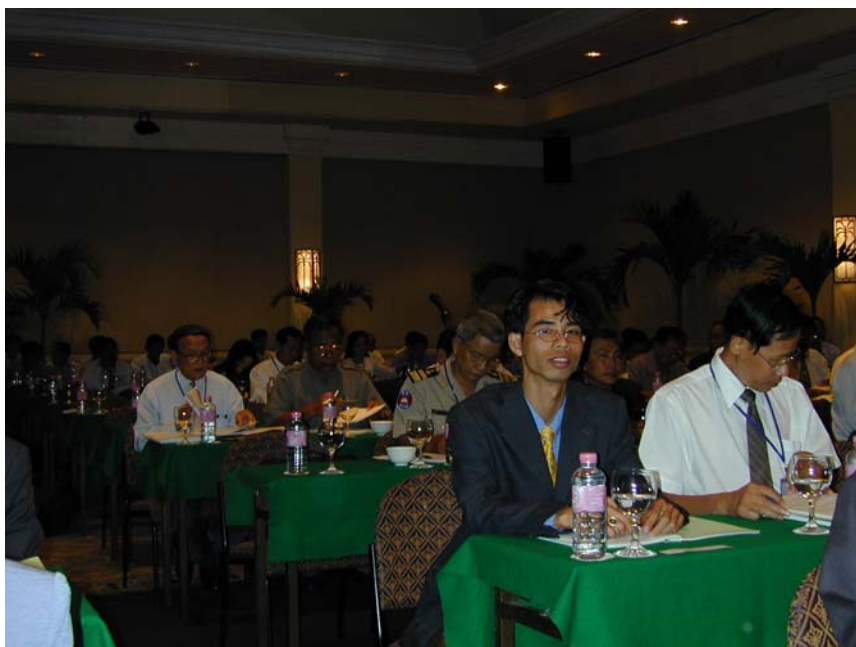
講演に熱心に聴き入る記念セミナー参加者