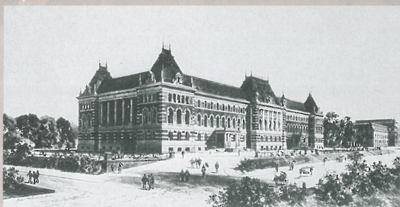
エンデ&ベックマン第一次計画案透視図