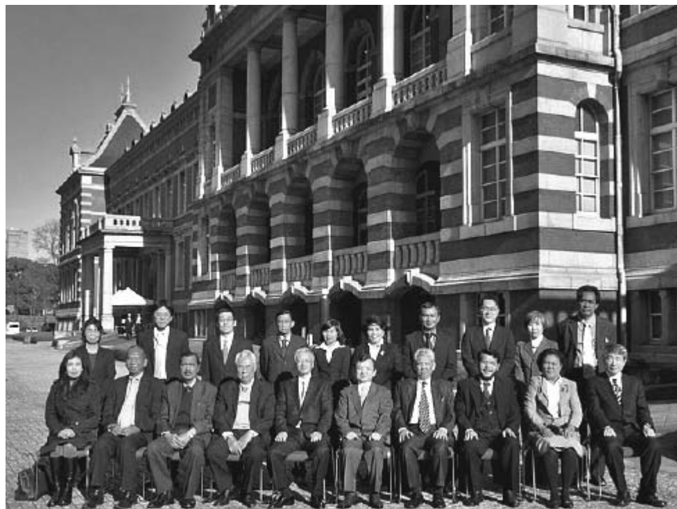
2011年11月29日インドネシア研修にて撮影

最後に、本研修に多大な御支援、御協力をいただいた裁判所や法科大学院、講師の方々をはじめとした関係者の皆様に深くお礼を申し上げます。