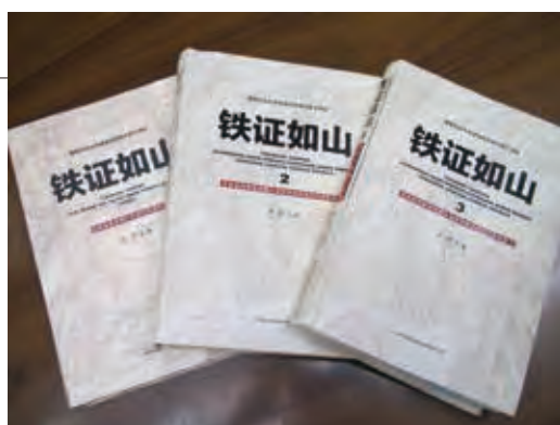
世界記憶遺産への登録申請に使われた史料の一部が掲載されている書籍『鉄証如山』(29頁コラム参照)

18日、中国が「中国人強制連行訴訟」の国内での提訴を初受理したほか、同月には「南京大虐殺」「慰安婦」関連史料の世界記憶遺産への登録を申請 ▶29・30頁へ