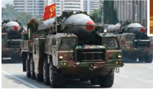
2013年7月の軍事パレードに登場した「ノドン」