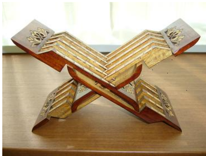
(イスラム教コーランの書見台)

しかし、この現場でしか学び得ないことを経験しながら、少しずつ一人前の国際協力専門官に成長していきます。そのうちに、各自が担当する対象国に実際に赴くことにより、一層その国に対する思い入れのようなものを抱くようになり、それ以前にも増して積極的に関わっていくこととなります。そういう次第ですので、本誌をお読みの関係者の方々にはともすれば御迷惑をおかけすることもあるかと思いますが、今後ともよろしく御協力いただきますよう国際協力専門官 OB としてお願いいたします。