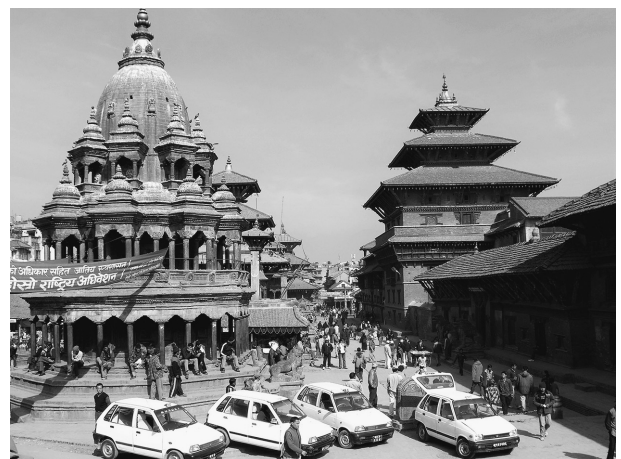
マッラ王朝の遺構 (旧パタン王宮)