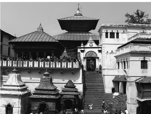
ネパール最大のヒンズー寺院