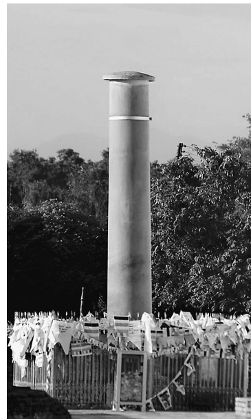
仏陀釈尊の生誕地ルンビニに建てられたアショカ王石柱