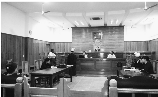
実際の法廷での審理風景