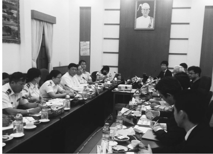
ヤンゴン税関職員との意見交換会