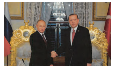
(ロシア大統領ウェブサイト) < http://kremlin.ru >