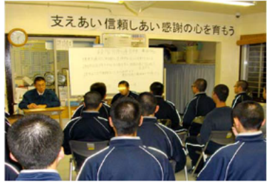
集団生活を通じての 社会化の促進（集会活動）

多摩少年院 は、関東近県1都10県において、第1種少年院送致決定を受けたおおむね17歳6月以上の男子少年を収容する施設です。矯正教育課程としては、社会適應を円滑に進めるための各種の指導を実施する社会適應課程Ⅰ（A1）が置かれています。