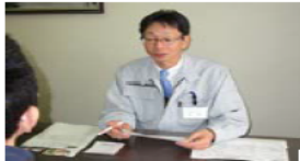
ハローワーク職業相談

ハローワーク就労支援（職業講話・職業相談・職業紹介） 院外外出・外泊（受験・更生保護施設等）