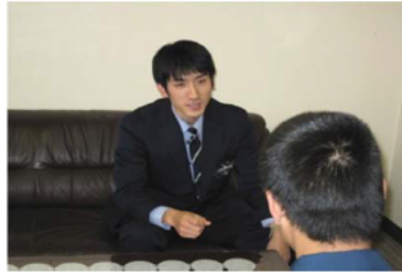
処遇の個別化（個別面接）

少年院 は、家庭裁判所の審判により、保護処分として少年院送致決定を受けたおおむね12歳以上20歳未満の少年を収容し、生活指導・職業指導・教科指導等を中心とした教育・訓練を行い、社会生活に適應できる健全な少年に育成することを目的とした法務省の施設です。