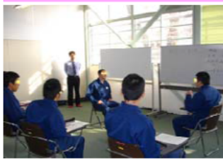
出院準備講座 SST（社会適應訓練）

ハローワーク就労支援（職業講話・職業相談・職業紹介） 院外外出・外泊（受験・更生保護施設等）