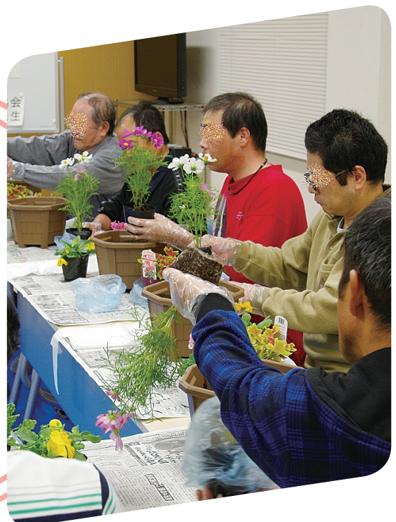
園芸療法場面(福島)