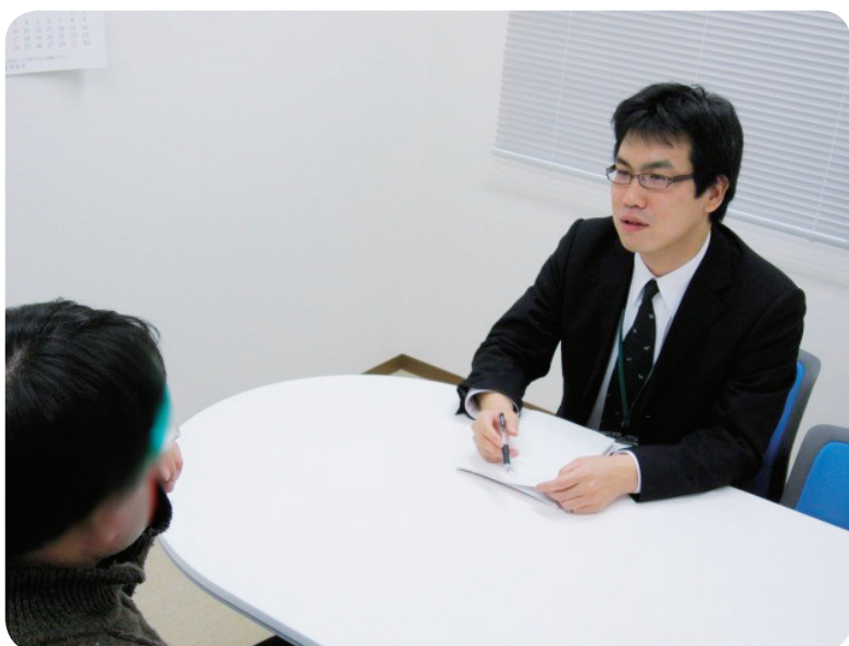
面接指導（イメージ）