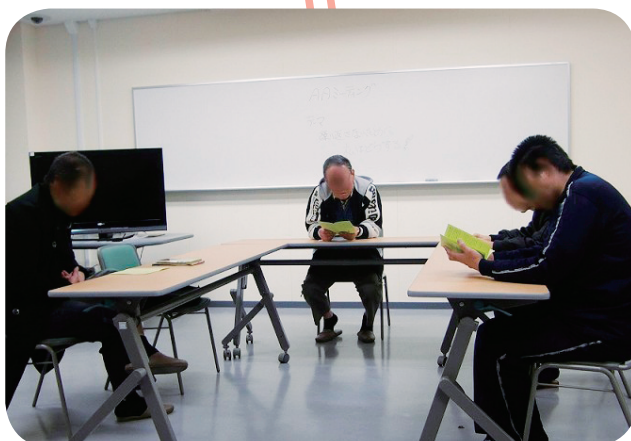
センターの一室を利用して行われているAAによるミーティング(北九州) アルコール依存症のある人などが集って、自分の体験などを語り合い、依存からの回復などを目指しています。(AA: アルコホーリック・アノニマス)