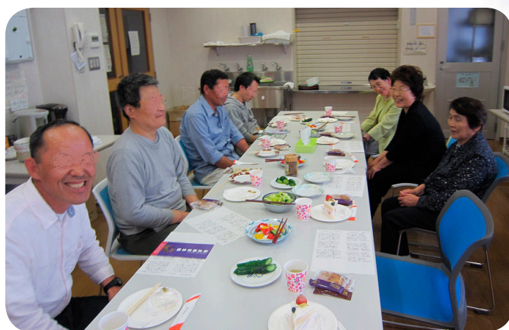
ボランティア主催の茶話会（福島）