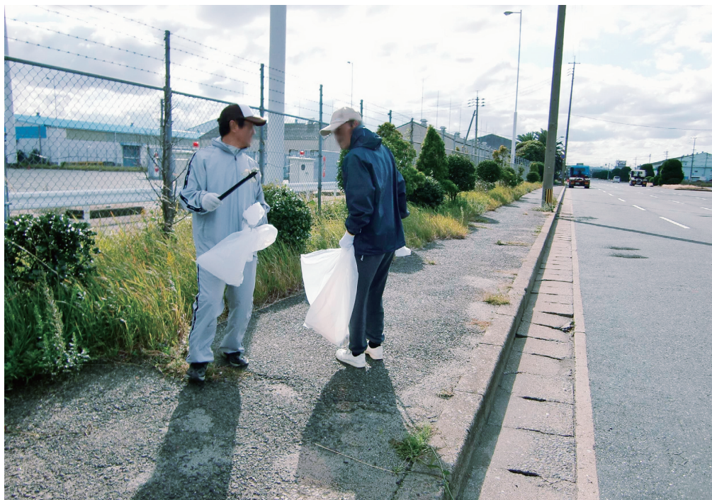
センター近隣の清掃活動（北九州）