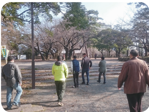
レクリエーションによる初詣・散策(北九州)