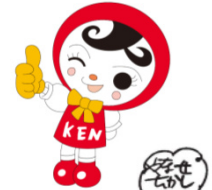
人権イメージキャラクター 人KENあゆみちゃん