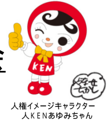
人権イメージキャラクター 人KENあゆみちゃん