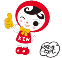
人権イメージキャラクター 人KENあゆみちゃん