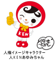
人権イメージキャラクター 人KENあゆみちゃん