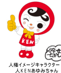
人権イメージキャラクター 人KENあゆみちゃん