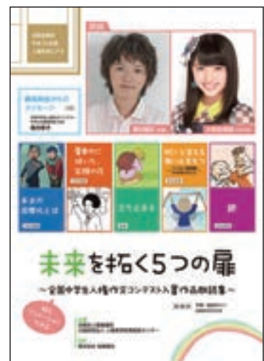
啓発ビデオ「未来を拓く5つの扉～全国中学生人権作文コンテスト入賞作品朗読集～」