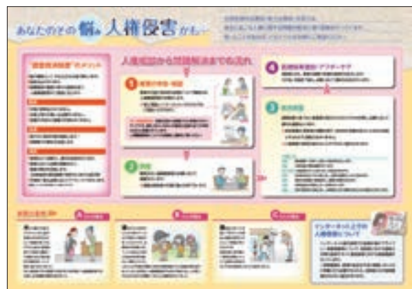
リーフレット 「法務局による相談・救済制度のご案内」