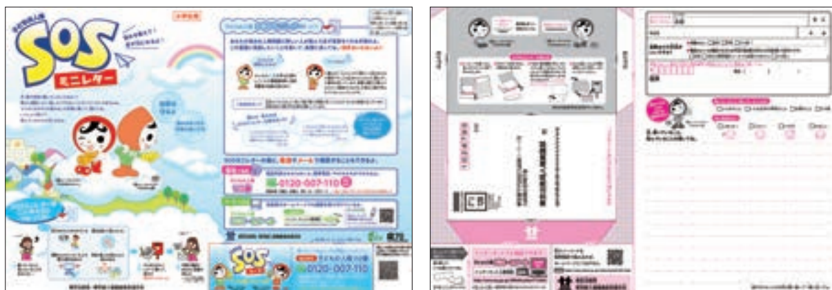
子どもの人権SOSミニレター（小学生向け）

子どもの人権110番を端緒に人権侵犯事件として立件し救済措置を講じた具体例は、以下のとおりである。