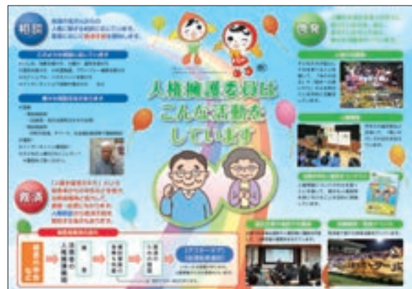
周知用リーフレット「人権擁護委員 あなたの街の相談パートナー」