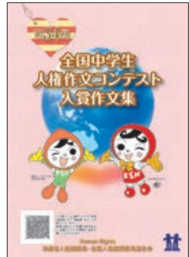
第34回全国中学生人権作文コンテスト入賞作文集