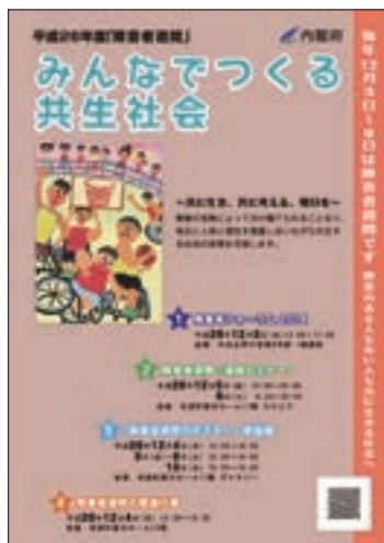
リーフレット「平成26年度『障害者週間』みんなで作る共生社会」