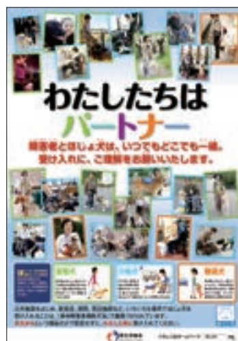
ポスター 「わたしたちはパートナー」