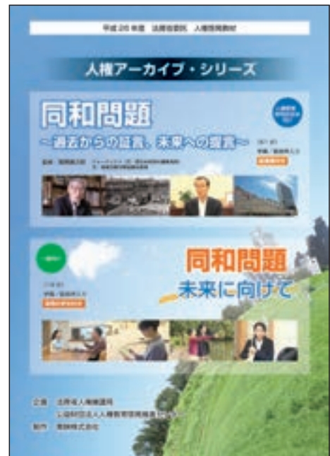
啓発教材「人権アーカイブ・シリーズ『同和問題～過去からの証言、未来への提言～』／『同和問題 未来に向けて』」

平成26年度は、同和問題をテーマにした人権啓発教材「人権アーカイブ・シリーズ『同和問題～過去からの証言、未来への提言～』（人権教育・啓発担当者向け・証言集及びビデオ）／『同和問題 未来に向けて』（一般向け・ビデオ）」を作成し、完成披露試写会と監修者対談を行った。同教材は、法務局・地方法務局において貸し出しているほか、YouTube法務省チャンネルで配信している。