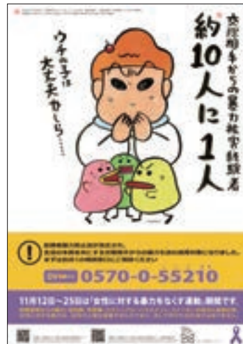
ポスター 「女性に対する暴力をなくす運動」