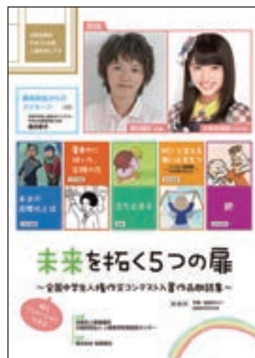
啓発ビデオ「未来を拓く5つの扉～全国中学生人権作文コンテスト入賞作品朗読集～」