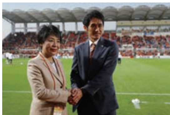
スタジアムにおける啓発活動

法務省の人権擁護機関では、いじめの防止等の人権尊重思想を若年層に普及させるため、フェアプレーの精神等をモットーとし、青少年層や地域社会において世代を超えた大きな影響力を有するJリーグ加盟チームを始めとしたスポーツ組織と連携・協力している。特にJリーグとは、従来から、スタジアムにおける各種啓発活動や人権スポーツ教室への選手派遣等、ファン・