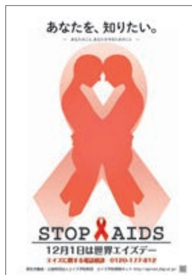
ポスター 「平成26年度『世界エイズデー』」

最優秀作品を世界エイズデーキャンペーンポスターのデザインに採用し、全国各地で掲示することにより、HIV・エイズについて理解を深めてもらうよい機会となっている。