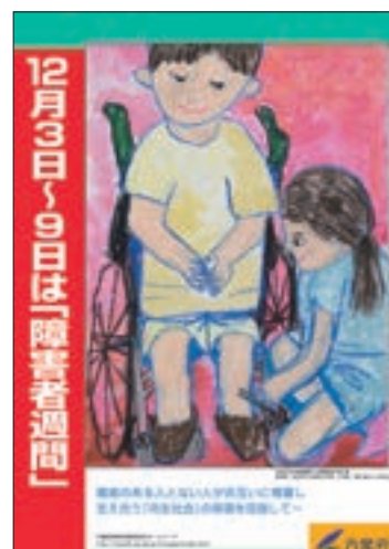
ポスター「障害者週間」

平成26年12月3日に東京都千代田区で開催された「障害者フォーラム2014」において、全国から募集した「心の輪を広げる体験作文」及び「障害者週間のポスター」の最優秀作品の内閣総理大臣表彰等を行った。このほか、障害者週間のポスターの優秀作品の原画展を東京都千代田区で開催した（詳細は、「障害者白書」に記載）。また、障害者フォーラム2014の開催に当たり、聴覚障害等の出席者のために手話通訳者や要約筆記者を会場に配置した。また、視覚障害の出席者へ点字版資料の配布を行った。さらに、内閣府ホームページからのインターネットを介し動画配信を行い、障害者施策の推進について国民への周知を図った。なお、動画配信に当たっては、字幕を付すなど障害のある人に対しても正確かつ迅速な情報の発信がなされるよう配慮している。