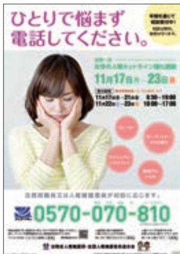
ポスター 「女性の人権ホットライン強化週間」