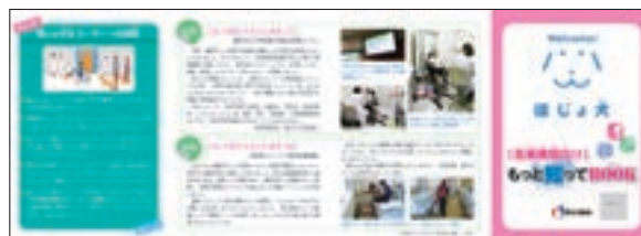
パンフレット 「医療機関向け ほじょ犬 もっと知ってBOOK」