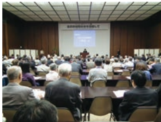
高齢社会フォーラム

内閣府では、高齢者の社会参加や世代間交流を促進するため、平成26年7月に東京都千代田区、同年10月に神戸市において「高齢社会フォーラム」を開催するなどの事業を実施した。