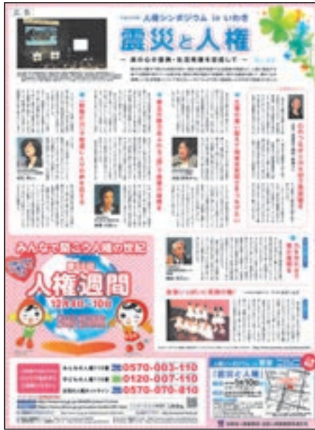
人権週間に関する新聞記事・啓発広告(読売新聞)