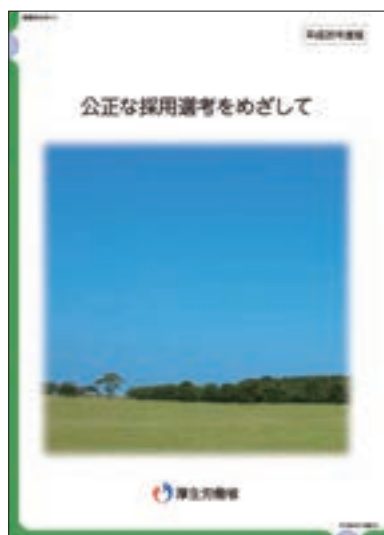
ガイドブック 「公正な採用選考をめざして」