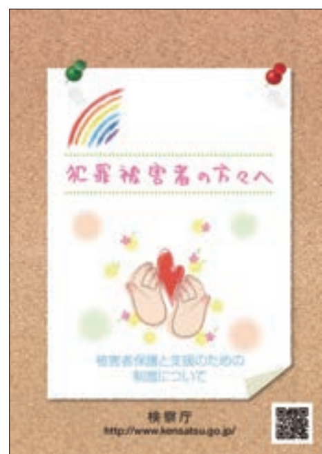
パンフレット「犯罪被害者の方々へ」

さらに、法務省の人権擁護機関では、犯罪被害者やその家族の人権問題に対する配慮と保護を図るため、「犯罪被害者とその家族の人権に配慮しよう」を年間強調事項の一つとして掲げ、講演会等の開催、啓発冊子の配布等の啓発活動