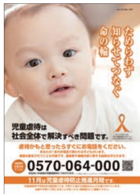
ポスター「児童虐待防止の推進」

平成26年度は、月間標語の公募・決定、「子どもの虐待防止推進全国フォーラム」の開催(11