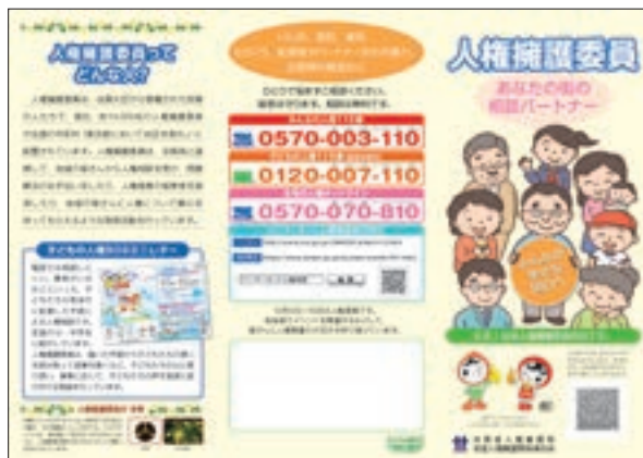
周知用リーフレット「人権擁護委員 あなたの街の相談パートナー」