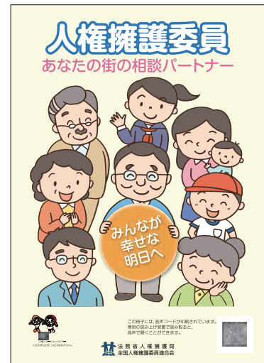
周知用冊子 「人権擁護委員 あなたの街の相談パートナー」