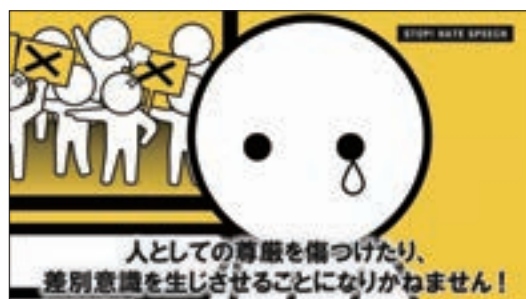
スポット映像「ヘイトスピーチ、許さない。」

(参考) ヘイトスピーチに焦点を当てた啓発活動に関する上川法務大臣発言（平成27年1月16日閣議後記者会見（抜粋））