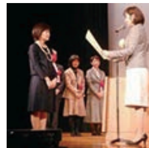
平成26年度農山漁村男女共同参画優良活動表彰

さらに、農山漁村女性の役割を正しく理解・評価し、女性の能力の一層の活用を促進するために制定した「農山漁村女性の日」（毎年3月10日）にちなんで、3月上旬に各女性関連団体による会議等が開催されるとともに、「農山漁村男女共同参画優良活動表彰」を行うなど、男女共同参画に関する気運の醸成に努めた。