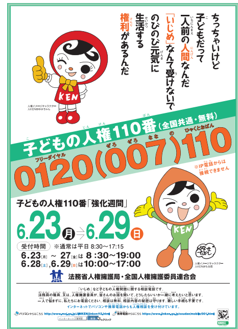
ポスター「子どもの人権110番強化週間」

法務省の人権擁護機関では、①専用相談電話「子どもの人権110番」(フリーダイヤル0120-007-110(全国共通))を設置し、子どもが相談しやすい体制をとっている。取り分け、平成26年6月23日から29日までの1週間を「全国一斉『子どもの人権110番』強化週間」とし、平日の相談受付時間を延長するとともに、土曜日・日曜日も開設した。また、②法務省ホームページ上に「インターネット人権相談受付窓口(SOS-eメール)」( http://www.moj.go.jp/JINKEN/jinken113.html )を開設している。さらに、③子どもの人権SOSミニレターを全国の小・中学校の児童生徒に配布するなど、子どもたちがより相談しやすい体制を整備している。