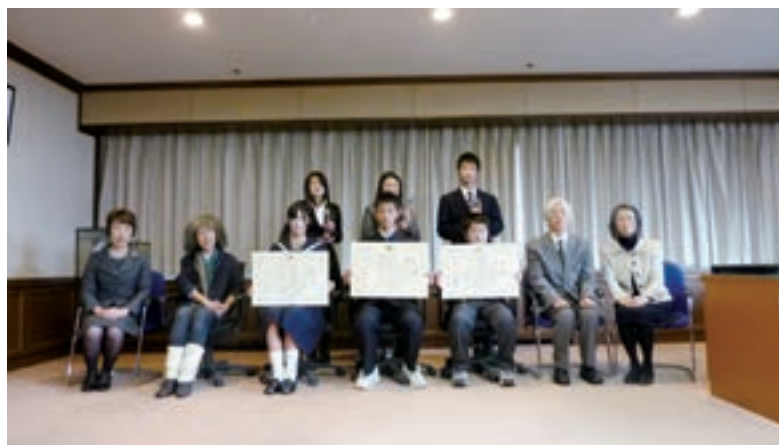
第34回全国中学生人権作文コンテスト中央大会表彰式

さらに、平成26年度においては、優秀作品を世界に発信することを目的に新たな試みとして、第34回大会の優秀作品3作品について、英語に翻訳の上、コンテストの紹介文と共に法務省ホームページ（英語版）に掲載した。加えて、人権啓発ビデオ「未来を拓く5つの扉～全国中学生人権作文コンテスト入賞作品朗読集～」を作成し、法務局・地方法務局において貸し出しているほか、YouTube法務省チャンネルで配信している。