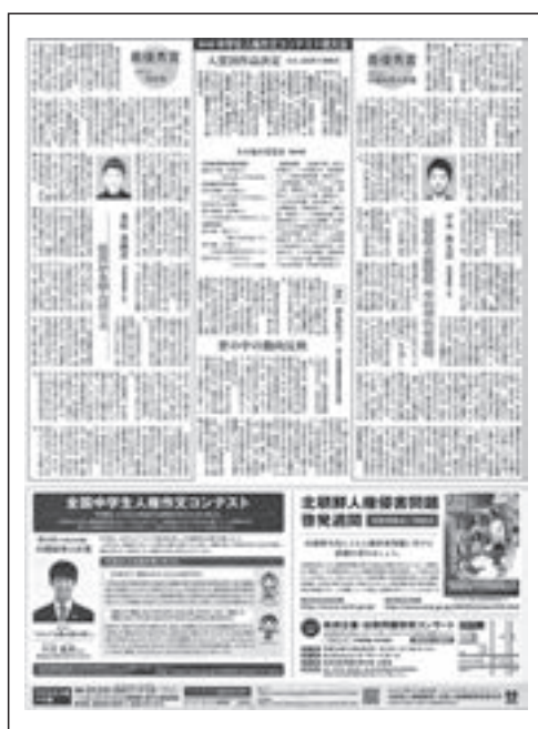
佐賀新聞 平成26年12月4日付け掲載

全国中学生人権作文コンテストに関する記事及び啓発広告を地方紙（52紙）に掲載（平成26年11月1日～12月12日）