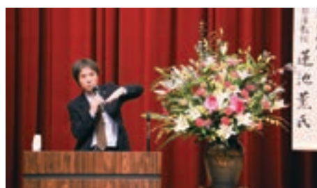
拉致問題を考える講演会とコンサートの集い