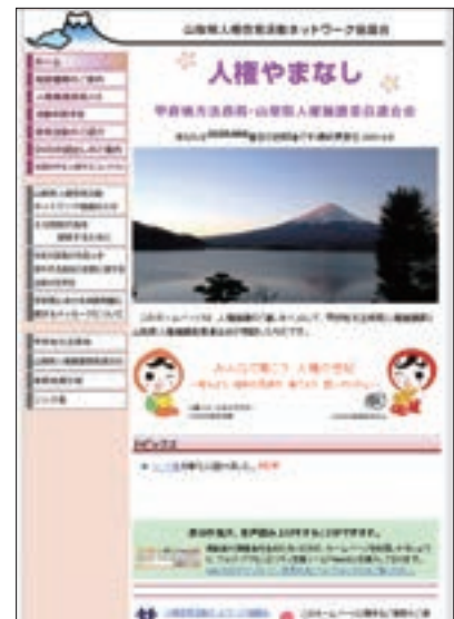
人権啓発活動ネットワーク協議会ホームページ

人権教育・啓発に関する基本計画については、法務省 ( http://www.moj.go.jp/JINKEN/JINKEN83/jinken83.html ) 及び文部科学省ホームページ ( http://www.