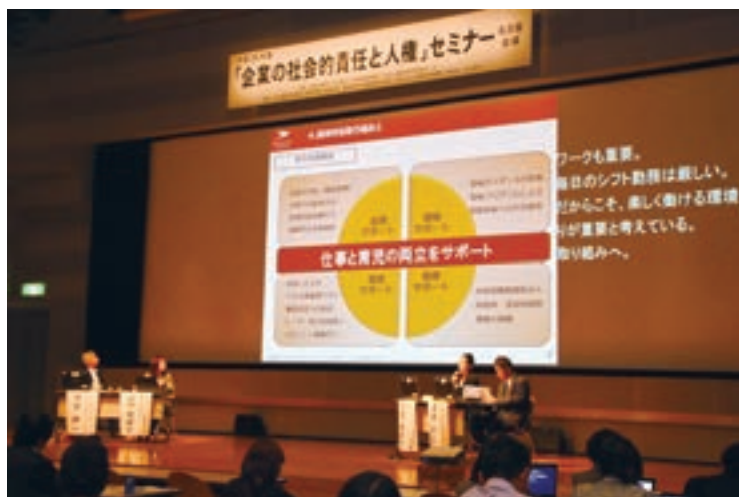
平成26年度「企業の社会的責任と人権」セミナー