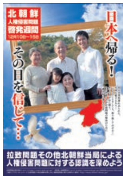
ポスター「北朝鮮人権侵害問題啓発週間」