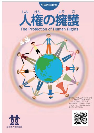
啓発冊子 「平成26年度版 人権の擁護」