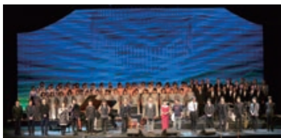
「ふるさとの風」コンサート

さらに、同週間の周知を目的としたインターネットバナー広告及び交通広告の実施、全国の地方新聞52紙に啓発週間を周知する広告の掲載、ポスター及びチラシの掲出や関係府省庁、地方公共団体と連携したポスターの掲出、拉致問題啓発のためのテレビスポットCM及びWebスポットCMの放映等、同週間にふさわしい活動に取り組んだ。