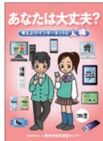
啓発教材「あなたは大丈夫？考えよう！インターネットと人権」

警察では、私事性的画像記録の提供等による被害の防止に関する法律の施行を踏まえ、私事性的画像記録等に係る事案の現状・対策、早期相談の重要性、削除申出方法等、被害防止のための広報啓発活動をより一層推進している。