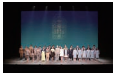
拉致問題啓発演劇公演 「めぐみへの誓い—奪還—」

拉致問題対策本部は，地方公共団体及び民間団体との共催等による啓発行事として「地方版『拉致問題を考える国民の集い』」を地方都市（茨城県那珂市，栃木県宇都宮市，札幌市，石川県金沢市，秋田市，鳥取県米子市，鹿児島県鹿屋市，東京都豊島区，仙台市）において開催したほか，住民向けの啓発活動の一環として，地方公共団体等と共催で，映画「めぐみ—引き裂かれた家族の30年」の上映会を開催した。また，平成26年3月に新潟市で開催した拉致問題啓発公演「めぐみへの誓い—奪還—」を同年4月に横浜市，平成27年1月に東京都豊島区，同年2月に北海道石狩市で開催した。