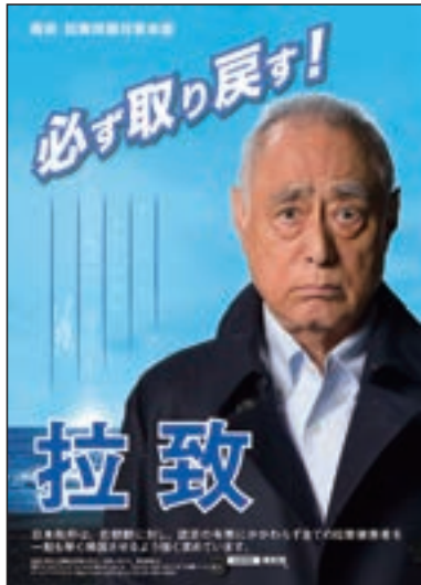
ポスター「拉致 必ず取り戻す！」 (津川雅彦氏)

問題を知るひろば」の内閣府庁舎1階への設置，そのパネルの文化祭等への貸出，政府インターネットテレビ動画「必ず取り戻す！北朝鮮による日本人拉致問題の解決へ」やDVD「拉致問題の解決に向けて」の制作・配信，学校における映画「めぐみ—引き裂かれた家族の30年」及びアニメ「めぐみ」の上映会の開催等を行った。