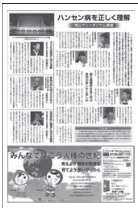
ハンセン病啓発広告 (朝日中学生ウィークリー)