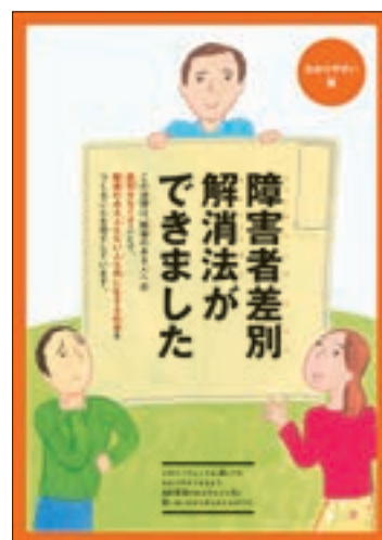
リーフレット「障害者差別解消法（わかりやすい版）」