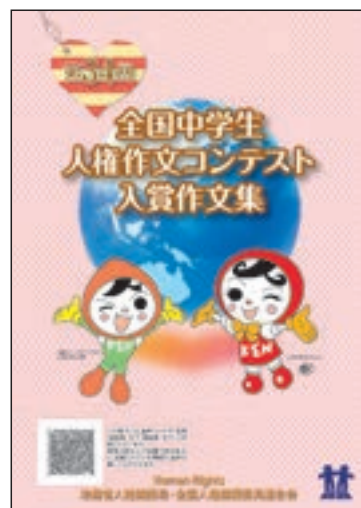
第34回全国中学生人権作文コンテスト入賞作文集