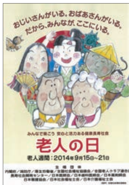
ポスター「老人の日・老人週間」

厚生労働省では、平成26年9月15日から21日までの1週間を「老人の日・老人週間」と定め、「国民の間に広く老人の福祉についての関心と理解を深めるとともに、老人に対し自らの生活の向上に努める意欲を促す」という趣旨にふさわしい行事が実施されるよう、関係団体等に対する支援、協力、奨励等を都道府県等に依頼した。また、内閣府、消防庁、全国社会福祉協議会等の主唱12団体は、「みんなで築こう安心と活力ある健康長寿社会」を標語とする「平成26年『老人の日・老人週間』キャンペーン要綱」を定め、その取組を支援した。