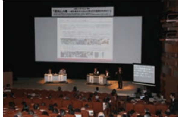
人権シンポジウム「震災と人権～被災者の方々の心に寄り添う復興のために～」(東京会場)