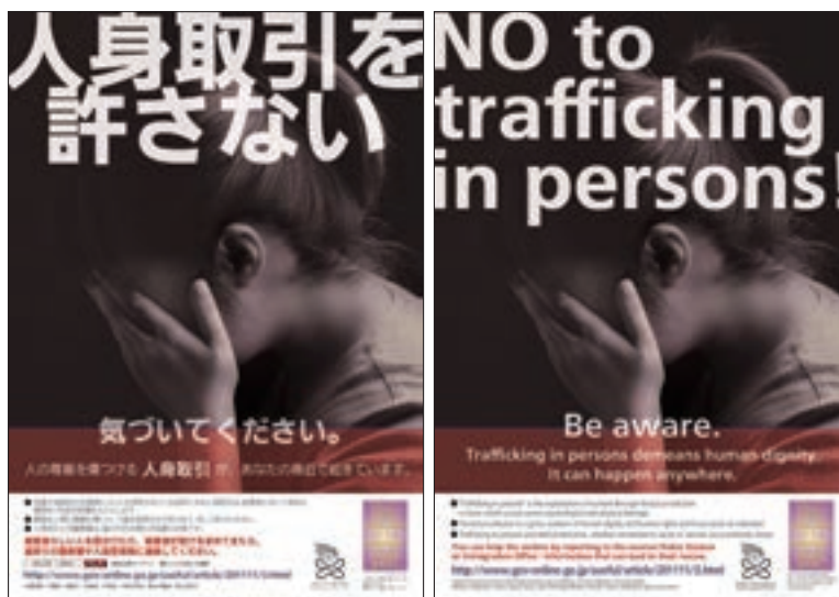
ポスター「人身取引対策」

また、平成27年1月13日に開催した人権に関する国家公務員等研修会において、「多文化共生を考える～人身取引問題の視点から～」と題する講演及び警察庁企画の啓発