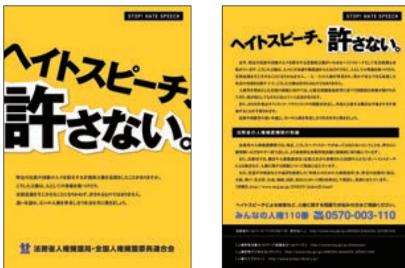
リーフレット「ヘイトスピーチ、許さない。」

これらの啓発活動と合わせて、ヘイトスピーチによる被害等の人権に関する問題の相談窓口を分かりやすく周知するなどしている。