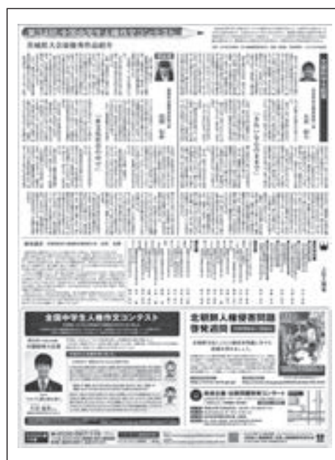
茨城新聞 平成26年12月6日付け掲載