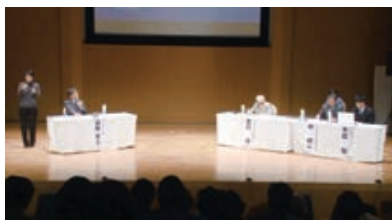
第14回ハンセン病問題に関するシンポジウム (熊本会場)

(ア) 厚生労働省では、ハンセン病に対する正しい知識の普及のため、様々な普及啓発活動を行っている。平成21年度から「ハンセン病療養所入所者等に対する補償金の支給等に関する法律」(平成13年法律第63号)の施行日である6月22日を「らい予防法による被害者の名誉回復及び追悼の日」と定め、平成26年6月20日に東京都千代田区において厚生労働省の主催により、法務省等の関係機関の出席を得て、追悼、慰霊及び名誉回復の行事を実施した。