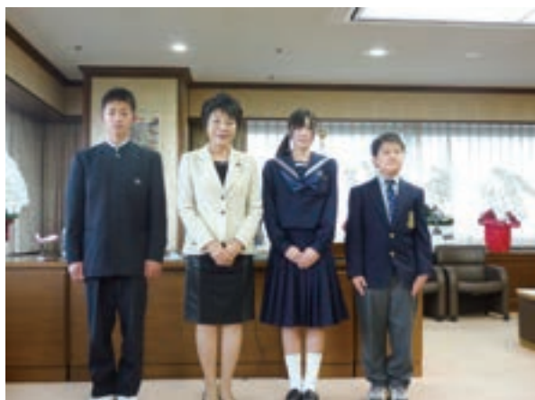
受賞者と上川法務大臣