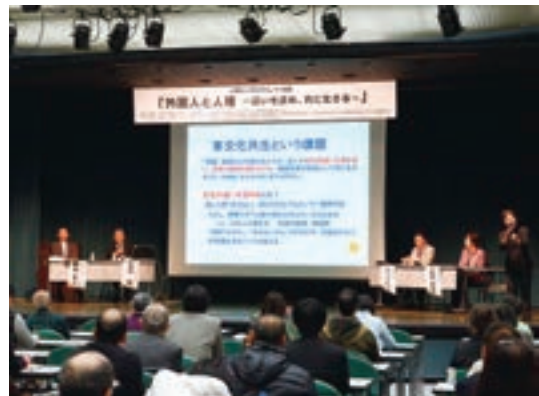
人権シンポジウム「外国人と人権」（大阪会場）

さらに、腹話術師のいっこく堂氏によるスポット映像「こころも国際化しませんか?」をYouTube法務省チャンネルで配信している。