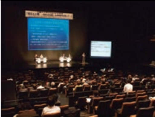
人権シンポジウム「震災と人権～真の心の復興・生活再建を目指して～」(いわき会場)

知識普及のため、講演会や研修会等へ放射線等に関する専門家を派遣するなど情報発信を行った。