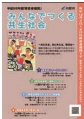
リーフレット「平成26年度『障害者週間』みんなで作る共生社会」