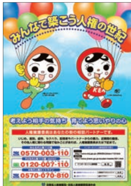
ポスター「平成26年度啓発活動重点目標」

平成26年度は、啓発活動重点目標を「みんなで築こう 人権の世紀 ～考えよう 相手の気持ち 育てよう 思いやりの心～」と定め、21世紀が「人権の世紀」であることを改めて思い起こし、国民一人一人が人権を尊重することの重要性を正しく認識し、全ての人々が相互に共存し得る平和で豊かな社会の実現に向けた啓発活動を展開した。