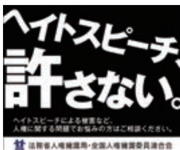
インターネット広告「ヘイトスピーチ、許さない。」