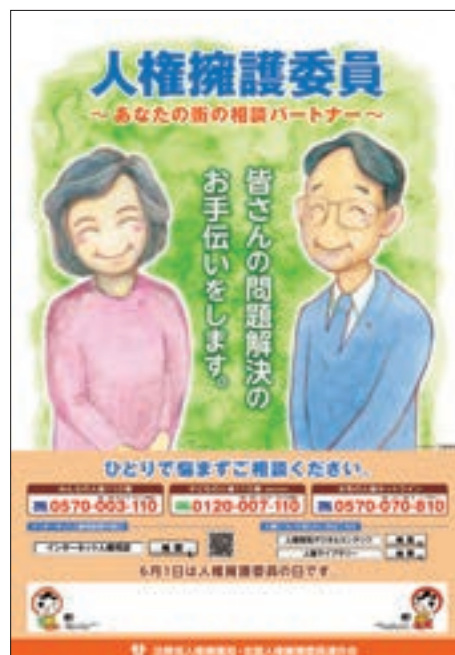
ポスター「人権擁護委員制度」

(注)「特設の人権相談所」は、法務局長又は地方方法務局長と人権擁護委員協議会長が、協議の上、日時及び場所を定めて開設する相談所をいい、土曜日、日曜日又は祝日に法務局・地方方法務局及びその支局で開設するものや、デパート、公民館、福祉施設等で開設するものがある。