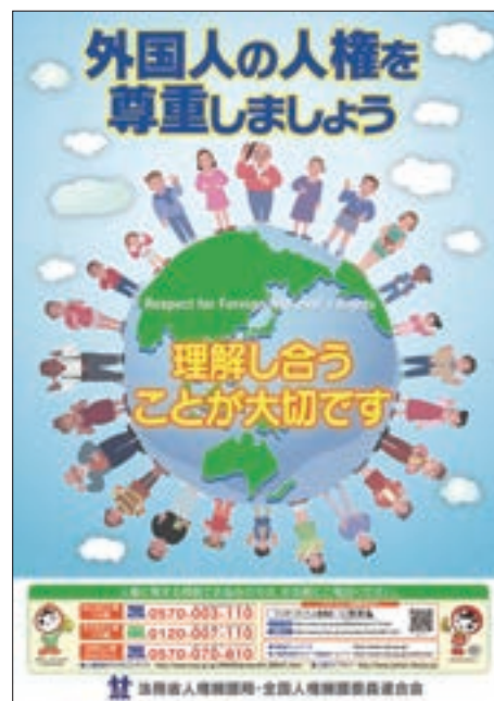
ポスター「外国人の人権を尊重しましょう」