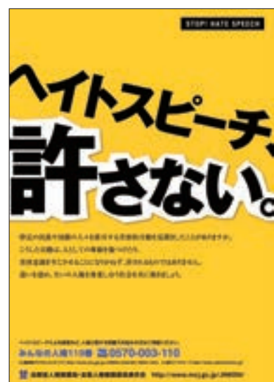
ポスター 「ヘイトスピーチ、許さない。」