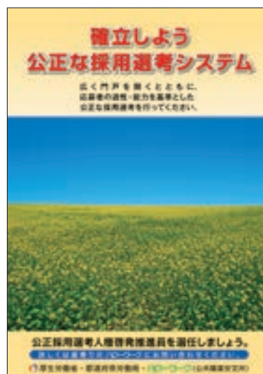
ポスター 「確立しよう公正な採用選考システム」