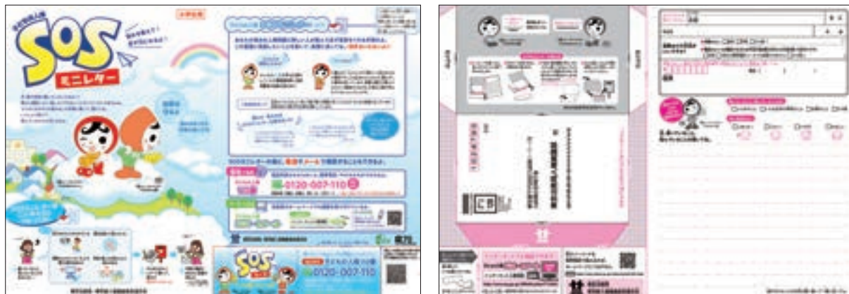
子どもの人権SOSミニレター（小学生向け）

子どもの人権110番を端緒に人権侵犯事件として立件し救済措置を講じた具体例は、以下のとおりである。