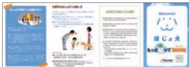
パンフレット 「ほじょ犬 もっと知ってBOOK」