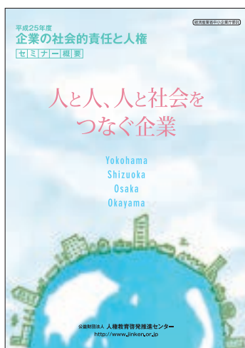
パンフレット「平成25年度『企業の社会的責任と人権』セミナー概要」

また、併せて、企業の社会的責任や情報モラルに係る啓発活動の参考となるべきパンフレットを経済団体や企業等に配布した。