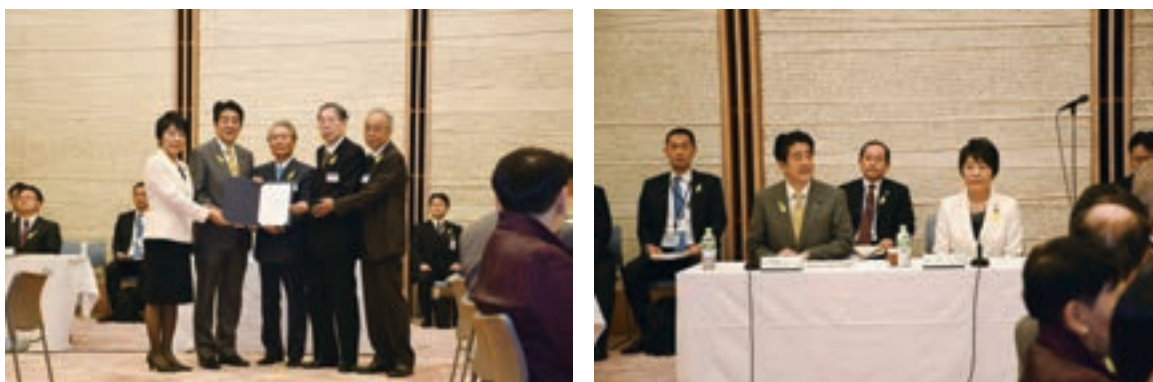
第65回“社会を明るくする運動”～犯罪や非行を防止し、立ち直りを支える地域のチカラ～中央推進委員会会議

犯罪や非行のない、全ての国民が安全で安心して暮らせる幸福な社会の実現を願うシンボルマークである「幸福の黄色い羽根 しあわせ 」の定着も図りながら、犯罪や非行をした人の立ち直り支援に対する国民の理解・協力を促進し、犯罪や非行のない明るい社会を築くため、様々な機関・団体と広く連携しながら、地域に根ざした国民運動として一層の推進を図っている。