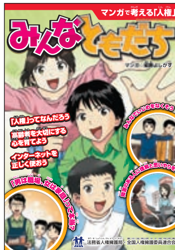
啓発冊子 「マンガで考える「人権」 みんなとむだち」