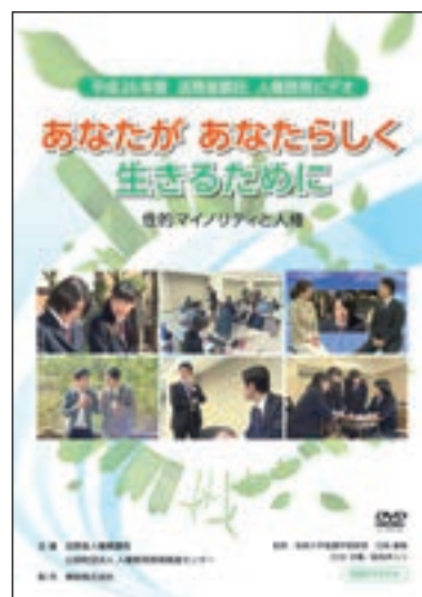
啓発ビデオ「あなたがあなたらしく生きるために 性的マイノリティと人権」

さらに、平成26年度は、性同一性障害をテーマとした人権啓発ビデオ「あなたがあなたらしく生きるために 性的マイノリティと人権」を作成し、法務局・地方法務局において貸し出しているほか、YouTube法務省チャンネルで配信している。