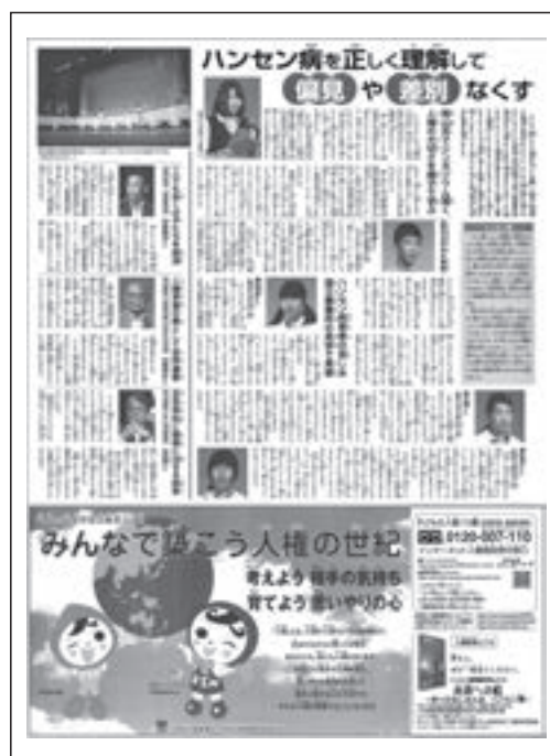
ハンセン病啓発広告 (朝日小学生新聞)