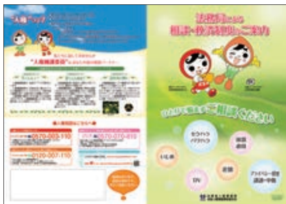
リーフレット 「法務局による相談・救済制度のご案内」