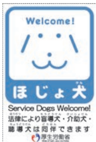
ステッカー 「ほじょ犬」

イ 厚生労働省では、「身体障害者補助犬法」（平成14年法律第49号）の趣旨及び補助犬の役割等についての一層の周知を目的として、ポスター、パンフレット、ステッカー等の作成・配布や、ホームページ（ http://www.mhlw.go.jp/topics/bukyoku/syakai/hojyoken/ ）の開設を行っている。