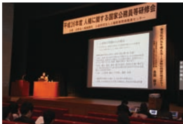
人権に関する国家公務員等研修会

エ 自治大学校では，地方公共団体の幹部となる地方公務員の政策形成能力等を総合的に養成することを目的に高度な研修を行っているが，平成26年度の人権教育については，2課程の課目の中で実施した。平成26年度は，112人が受講した。