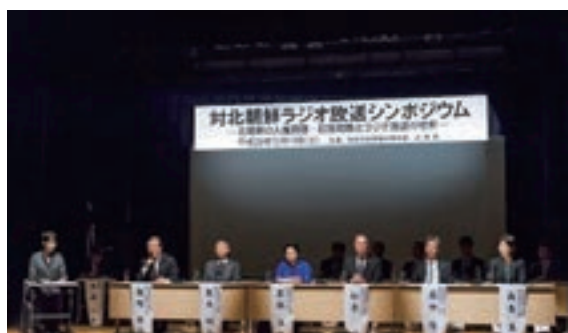
対北朝鮮ラジオ放送シンポジウム