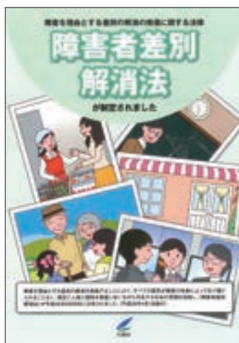
リーフレット「障害者差別解消法」