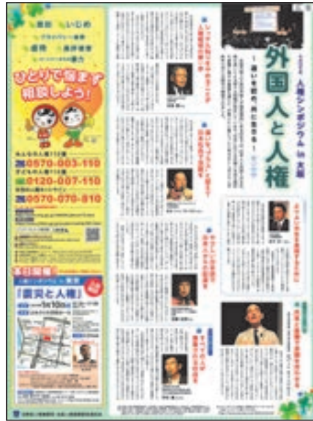
人権週間に関する新聞記事・啓発広告(読売新聞)