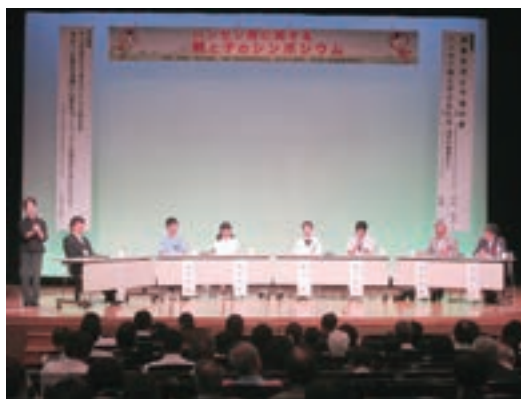
ハンセン病に関する「親子のシンポジウム」(岡山会場)

また、腹話術師のいっこく堂氏によるスポット映像「正しい知識が差別をなくす」をYouTube法務省チャンネルで配信している。