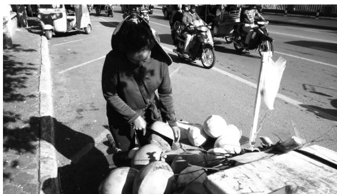
【ココナッツ・ジュースの売り子さん】

ちなみに、ちょっと深酒した翌朝は、ココナッツ・ジュースがオススメです。通勤途中に、路肩の売り子さんから手軽に買えます。新鮮で大きなココナッツをその場で割ってもらい、ストローを挿せば出来上がり。こちらは、ハッピー・アワーがありませんが、いつでも3000リエル（75セント）とやはり格安です。