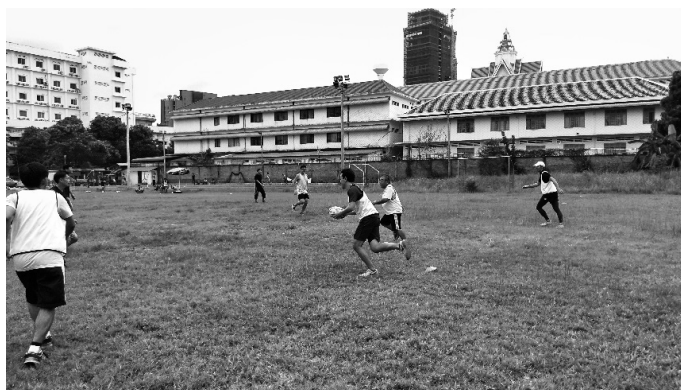
【タッチラグビーでボールと戯れる】