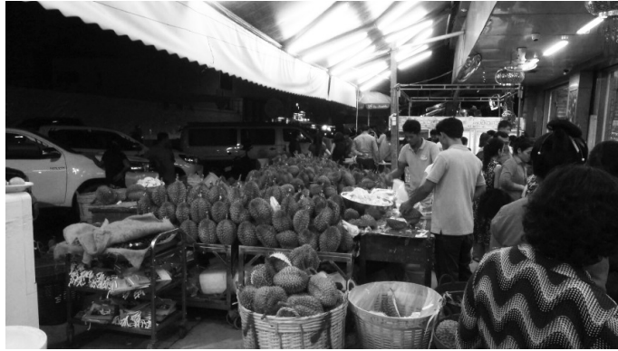
【果物店で山積みのドリアン】

ドリアンが臭いという話をすると、日本に詳しいカンボジア人は、納豆の方が臭いと反論してきます。この「ドリアン」VS「納豆」論争は、いまだ定説がないところですが、私は、「どちらも臭いが、美味しい」説を主張しています。