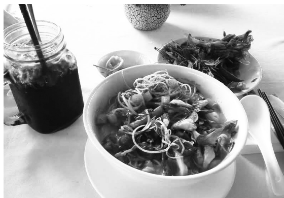
【レストラン版ノンバンチョック】