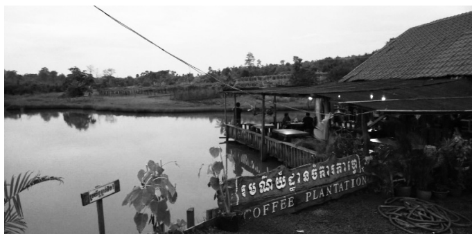
【丘陵地帯にあるコーヒー園】

空いてもいないグラスに何度も水を注ぎに来たり、汚れてもいないテーブルを何度も拭きに来たりする店員はいません。ボーっとするもよし、読書するもよし、人間観察するもよし。とにかく気兼ねなく、のんびりと過ごせます。