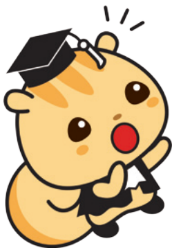
法教育マスコットキャラクター 「ハウリス君」

町としては、雇用創出や地域活性化などの観点から、この町ほぼ唯一の産業である観光産業を更に発展させたいと考えている一方で、住民だけでなく、観光客からの苦情も増加していることから、海水浴場の利用に関する条例を制定して、問題の解決を図りたいと考えている。