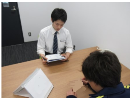
心理検査 (イメージ)