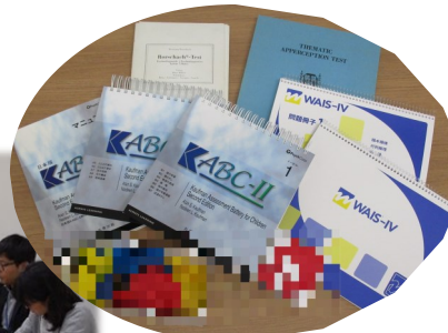
個別心理検査 の実施

○電話番号：042-500-5295 （相談専用） 042-500-5299 （講演等依頼用）