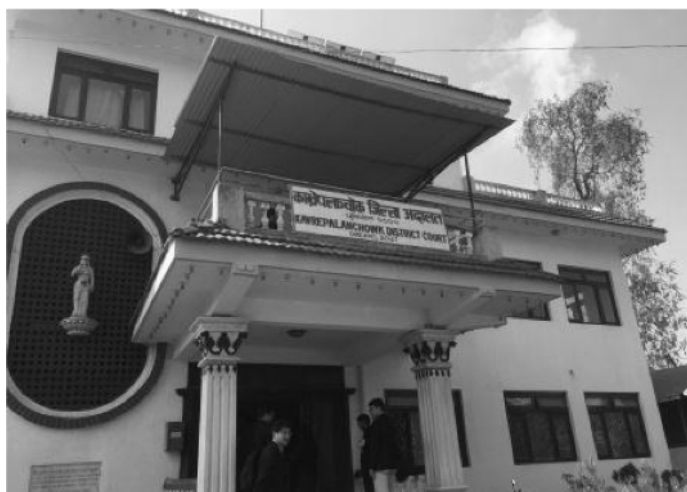
※上の写真は、地震前のもの。

カブレパランチョク地方裁判所 13 の建物は、壁面に大きな亀裂が入ったため、使用禁止となり、裁判官執務用のテント 14 が屋外に設置された。