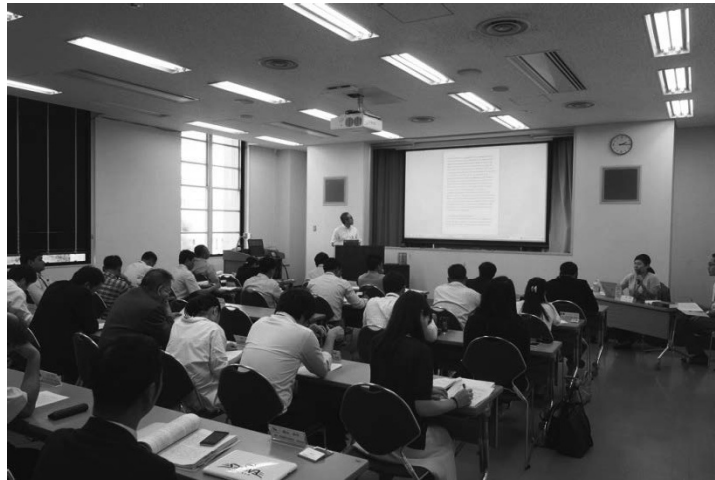
【東京大学・平野温郎教授の講義風景】