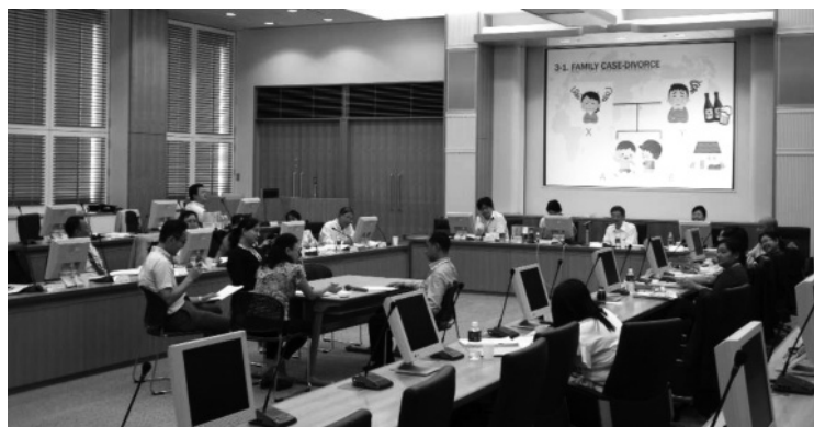
【模擬離婚調停を教室の中央で行っている様子】

それでも、課題の解決を考えながら、とりあえず実行してみようという意見が大半であり、連邦最高裁判所としても、今年か来年あたりには民事調停のパイロット的運用を行う方向とのことである。