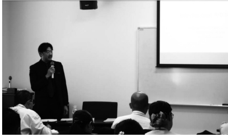
【国際仲裁に関する講義の様子】

日本は、現在、国際仲裁を活性化させ、日本での活用を拡大させる取組を行っており 2 、本研修において、副次的にその取組を紹介することもできた。