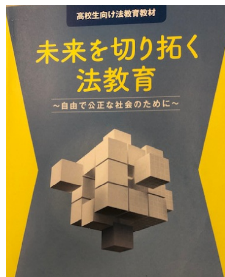
『未来を切り拓く法教育』(法務省)