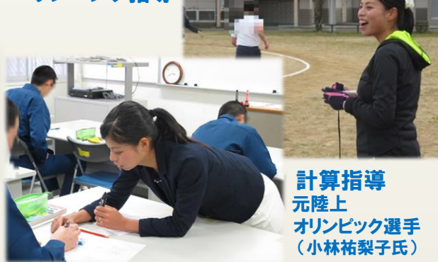
計算指導 元陸上 オリンピック選手 (小林祐梨子氏)