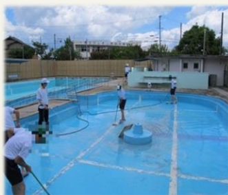
野外活動訓練 レガッタ体験