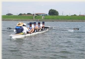
企画立案 ミーティング