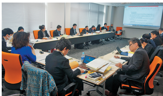
【意見交換会の様子（民事グループ）】

まず、民事グループについては、研修開始当初、各契約が定める要件を整理しないまま請求権の存否等に関する検討を行うなどの問題もみられたが、事実認定の考え方についての総論的な講義を受けた後に集中的に議論したことによって要件を整理することの意味を理解できたようであり、意見交換を重ねるにつれて徐々にコツを掴んでいく様子が見てとれた。また、刑事グループについては、研修開始当初、証人の証言が信用できるか否かを判断するための具体的要素や着眼点について十分に検討できていなかったが、意見交換を重ねるにつれて、多角的な視点からその要素を挙げ、それを踏まえた説明ができるようになるなど、具体的事例を通じて徐々に事実認定に関する理解を深めていく様子が見て取れた。