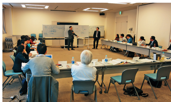
【意見交換会の様子（刑事グループ）】