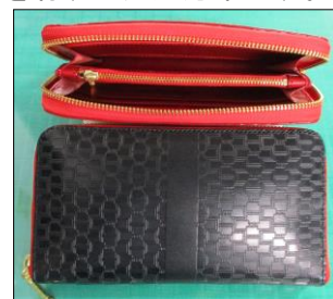
ロングウォレット