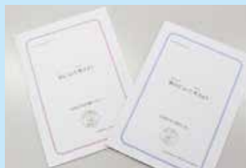
地域援助用ワークブックには、「暴力」、「性」、「窃盗」、「薬物」(いずれも全 3 回)があります。

当所の地域援助における最新の話題として、本年度から山形地方検察庁が入口支援を本格化させることに伴う連携が上げられます。これまでも、支援の一環として、当所は、被疑者に対する知能検査や認知症スケールを実施してきましたが、新たな取組として、既に 2 件の盗撮事案に関し、本人の同意を得た上で、検察庁を経由して依頼を受け、性的な問題に特化したワークブックを使った支援を実施しています。また、児童虐待が疑われる成人のケースに関しても協力を求められており、今後、児童相談所とも連携し、地域の再非行・再犯防止に努めていくつもりです。