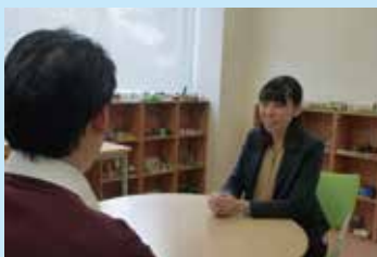
相談室に来てくださるだけで多くの労力を要したのではなく、相談室の空間を明るく保つよう配慮し、丁寧に言葉を聞いています。（写真のモデルは職員です）

これまでの法務技官としての経験や知見を地域の非行防止に直接還元できることが、地域援助の面白さです。多くの出会いを通じて、自分自身の専門性や応用力も磨いていきたいと感じています。