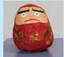
少年サポートセンターせんだいが行った立ち直り支援に、当所職員が参加し、作成した「だるま」です。

当所の地域援助の特徴は、司法、教育、保健・福祉、更生保護、そして矯正といった幅広い領域の関係機関と連携し、安定的に地域援助を進めてきたところです。少年鑑別所法施行（地域援助開始）前から維持してきた各機関との協力体制を基盤に、当所の持つアセスメント機能を様々な形で活用していただき、地域援助の実績は年々増加しています。今回は、宮城県警察と当所における協定に基づく取組を御紹介します。