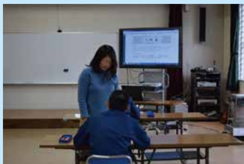
キャリアカウンセリングの様子

以上、当院の取組を紹介しましたが、社会生活について学ばせ、在院中に就労先あるいは進学先が決まることは、社会生活を送る基盤作りになるだけでなく、社会生活への自信や動機付けにもなります。そして、社会生活が安定することは、自分の居場所作り、再非行・再犯の防止へとつながりますので、1 年後、5 年後、10 年後を見据え、少年たちの特性や帰住環境、ニーズに沿った社会復帰支援に今後も力を注いでいきたいと考えています。