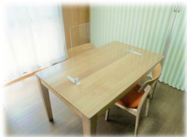
面接室に遮へい板を設置した様子