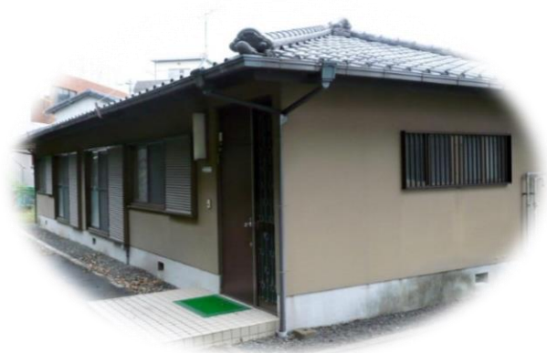
法務少年支援センターながさき（浦上青少年相談室）