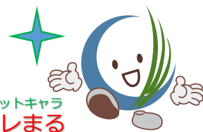
マスコットキャラ コレまる

◎出所者等雇用の流れなどの手続きについてのご相談も多くあります。コレワークにご連絡いただければ、詳しい説明や関係資料の送付をさせていただきます。ぜひご利用ください！