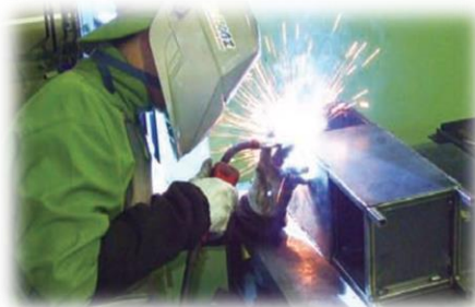
▲ 矯正施設の職業訓練の様子

最近3年間、矯正施設に入所している間に採用内定になるケースは毎年1000人を超え、年々増えています。