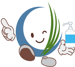
マスコットキャラ コレまる

春に向けて、私たちコレワークとともに刑務所出所者等の雇用について検討してみませんか?