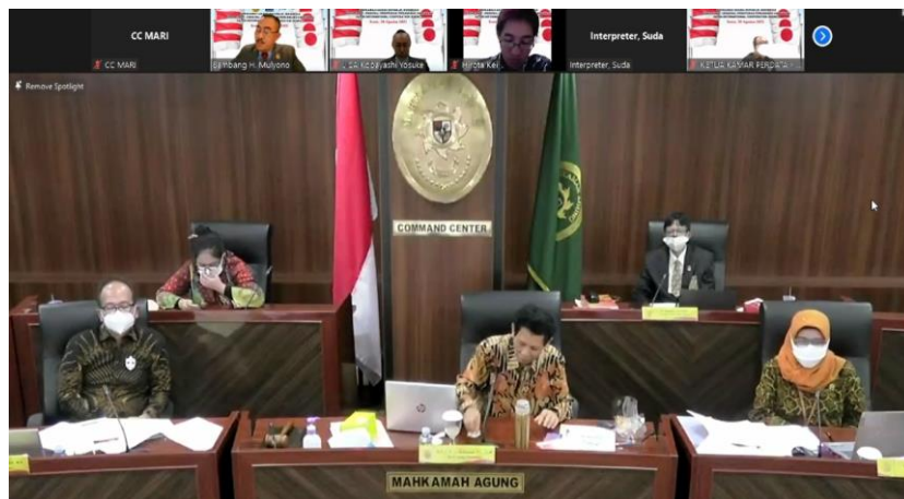
【インドネシアの会場の様子】

次期プロジェクトである「ビジネス環境改善のためのドラフター i の能力向上及び紛争解決機能強化プロジェクト」は、本年10月から開始します。国際協力部は、JICA等の関係者と引き続き、インドネシアのプロジェクト対象機関と協力し、インドネシアにおける法令間の整合性確保、知財事件等のビジネス関連事件に関する裁判官の法的判断及び訴訟運営の能力向上を目指して支援を続けていきます。