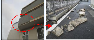
< 拘置所 >