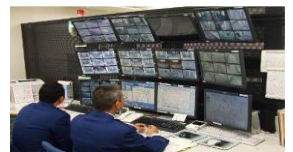
総合警備システム等

老朽化が著しい警備機器等の更新や総合警備システムの効率化・機能強化を進め、大災害発生時においても、矯正施設運営の安定化及び収容の確保を図ることで、国民の安全・安心を確保する。