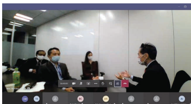
【稲葉先生が両当事者を前にオープニングを演じている場面（前回研修時）】

2 模擬調停のトレーニングでは、3人一組となって、調停人と両当事者をロールプレイし、ロールプレイが終わったら、振り返りを行う。各自のフィードバックを基に、実際の調停に役立たせることが期待されている。今回はZoomのブレイクアウトルーム機能を使用して、オンラインでロールプレイをしたが、ロールプレイのイメージは、下記のとおりである。右端の調停人が、両当事者（左から二人目が申立人、右から二人目が相手方）と初めて調停の席で出会い、調停とは何かなどを説明しているところを実演している。