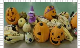
▲学院の農場で育てたおもちゃカボチャに顔を描いたものを子育て総 合支援センターへ