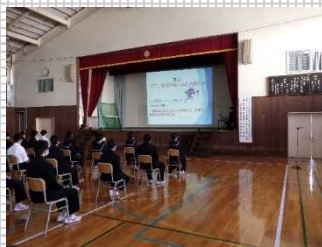
▲学校での薬物乱用防止教室