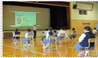
▲学校での薬物乱用防止教室