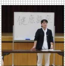
▲高齢受刑者に指導する 歯科衛生士及び看護師

非常勤 看護師 のほか、 精神保健福祉士 、 介護福祉士 、 就労支援スタッフ 、 美容師 などの協力を得ています。