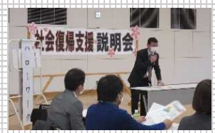
▲社会復帰支援説明会