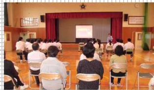
▲学校での非行防止教室