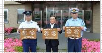
▲飲酒運転根絶啓発ランチョンマット

そのほかの取組は， 札幌矯正管区フロントページ 掲載の各施設の紹介資料を御覧ください。