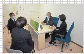
▲特別調整のための会議

また、就労支援を希望する者を対象に、ハローワークと連携して 合同企業説明会 や 雇用促進セミナー 、 社会復帰支援説明会 等を実施しています（就労支援）。