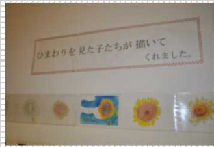
▲中学校の生徒さんから届いた絵とコメント