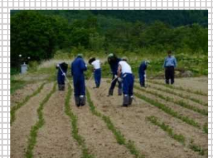
▲月形刑務所の農場での作業