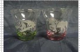
▲サンドブラスト加工のばんえいグラス