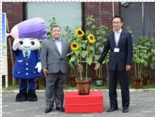
▲設置されたひまわりの花

全国的に取り組まれている「ひまわりの絆プロジェクト」に参画し、受刑者が育成したひまわりを市内及び近郊の道の駅に設置したほか、刑務所近隣の中学校からも、同プロジェクトへの賛同があったことから、学習の一環として同校においても展示することとなりました。