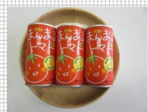
▲外部通働作業での生産品（トマトジュース）