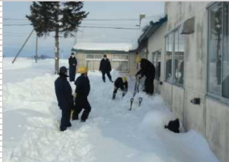
▲旭川市内公共施設の除雪