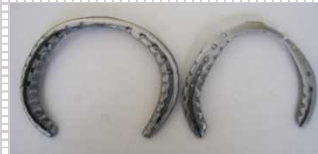
▲ばんえい競走馬の蹄鉄の飾り

特定非営利活動法人「とかち馬文化を支える会」を通じて、「ばんえい十勝」に登録している競走馬が使用した蹄鉄を磨き直して飾りにしたオフィシャルグッズ等を製作するなど，地域文化の継承の一助を担っています。