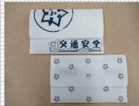
▲交通安全啓発マスクケース