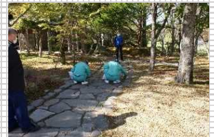
▲鶴ヶ袋公園内茶室「鶴翔庵」の清掃

釧路市公園緑地課と連携し、市が管理する鶴ヶ袋公園内に設置されている茶室「鶴翔庵」の内外の清掃を行っています。