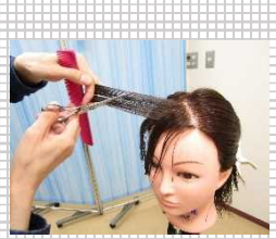
▲美容師による 技術指導