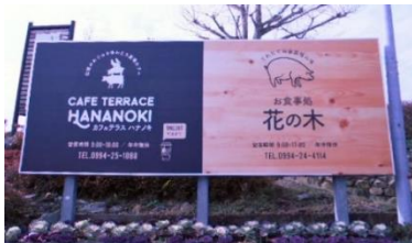
社会福祉法人白鳩会 花の木農場

「社会福祉法人白鳩会 花の木農場」は1972年から障害者の働き場所の確保のため農業に取り組んできた農福連携のパイオニアです。生きづらさや働きづらさを抱える人が多く働いており、実際に農福