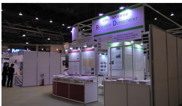
法務省法務総合研究所研究部の会場における展示の様子