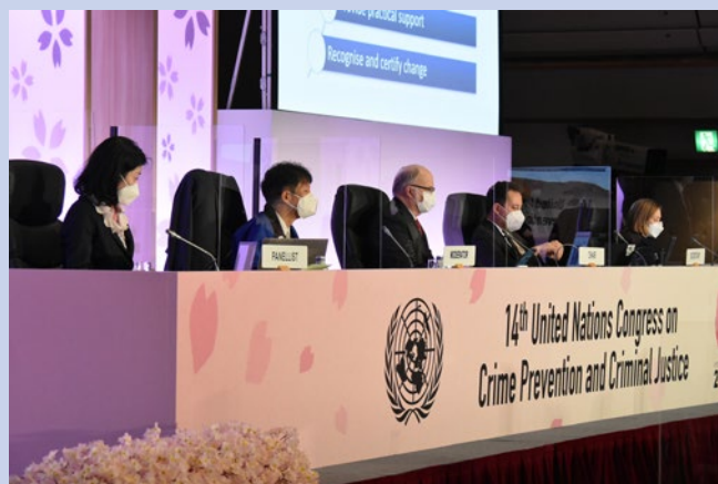
ワークショップ2の様子