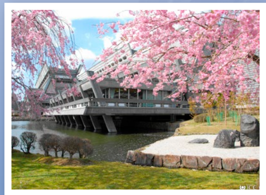
会場となった国立京都国際会館