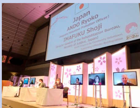
世界保護司会議の様子

「京都保護司宣言」は、刑事司法や犯罪者処遇の在り方、犯罪者の社会復帰を支える地域ボランティアの制度的発展のあるべき方向性を見据え、今後、国際社会や国連に対し、その協力とイニシアチブの発揮を求めていくべき事項、例えば、「再犯防止のために地域ボランティアを活用する国連準則（モデル戦略）」を策定すること、「罪を犯した人の立ち直りを支える地域ボランティア国際デー」（世界保護司デー）を設立することなどを提案している。我が国としては、京都保護司宣言の趣旨を踏まえ、「HOGOSHI」の輪を世界に広げ、犯罪者の社会復帰と再犯防止を推進し、誰一人取り残さない包摂的な社会を実現することに取り組んでいくこととしている。