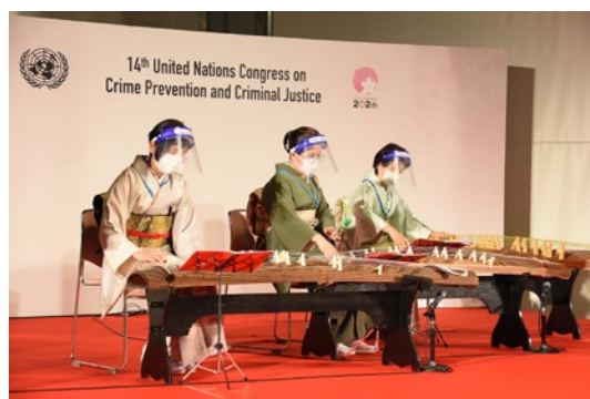
京都府更生保護女性連盟の方々による琴演奏の様子（展示会場内のイベント）