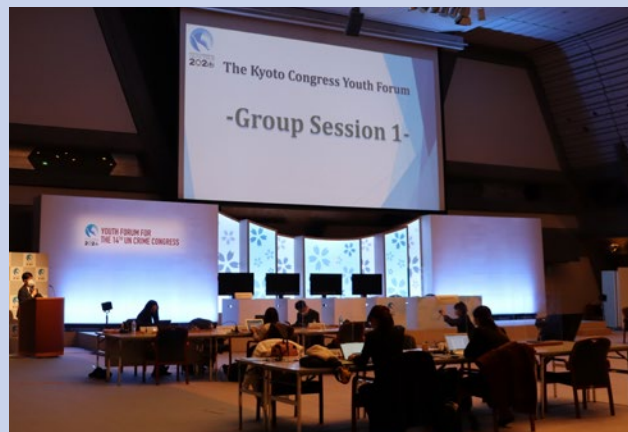
ユースフォーラムでの議論の様子

各国及び民間のステークホルダーに対し、ICTの利用によって拡大する犯罪を防止・撲滅するための国や地域による努力を支援する能力を構築するため、継続的かつ持続可能な資金援助を行うよう求める。