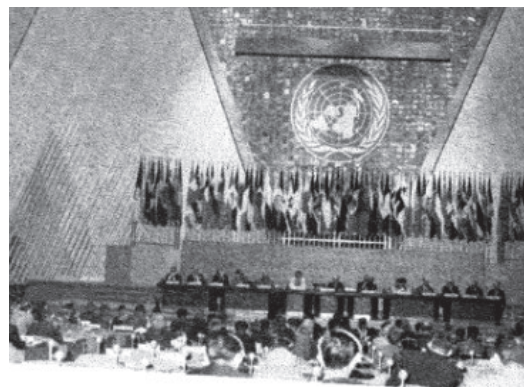
第4回コンGRESS（昭和45年（1970年）の様子）

我が国では、これまでに第4回コンGRESS（昭和45年（1970年）8月17日から同月26日までの10日間）及び第14回コンGRESS（令和3年（2021年）3月7日から同月12日までの6日間）の2回のコンGRESSが、いずれも京都市の国立京都国際会館を会場として開催された。第4回コンGRESSは、ヨーロッパ以外の国で初めて開催されたコンGRESSであり、コンGRESSにおける最初の政治宣言といえる「総会宣言」が採択された。同宣言は、①各国政府に対し、各国が計画している経済的・社会的開発の枠の中で、犯罪防止の施策を調整し、かつ、強化するための効果的な措置をとるよう要請する、②国連その他の国際機関に対し、犯罪防止の分野における国際協力の強化に高い優先権を与え、特に、犯罪と非行の防止及び規制に対し、施策を発展させるため効果的な技術援助を要請する国に対し、かかる援助を保障するよう促す、③犯罪防止の分野に、より直接的に、また、より意図的に関与していくため、一層効果的な措置をとるのに必要な行政上、専門上及び技術上の機構の在り方に特に留意するよう勧告する、といった内容であった（第14回コンGRESSについては、本編第2章参照）。