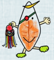
仙台少年鑑別所 マスコットキャラクター 「ふるじろつ」

仙台少年鑑別所は仙台市にあり、主として仙台家庭裁判所で観護措置決定を受けた少年を収容し、専門的知識及び技術に基づいて非行要因の分析・解明を行っているほか、法務少年支援センター仙台（ふるじろ心の相談室）として「地域とつながり、地域につなげる」をキャッチフレーズに、地域社会における非行・犯罪の防止や青少年の健全育成のための支援を行っています。