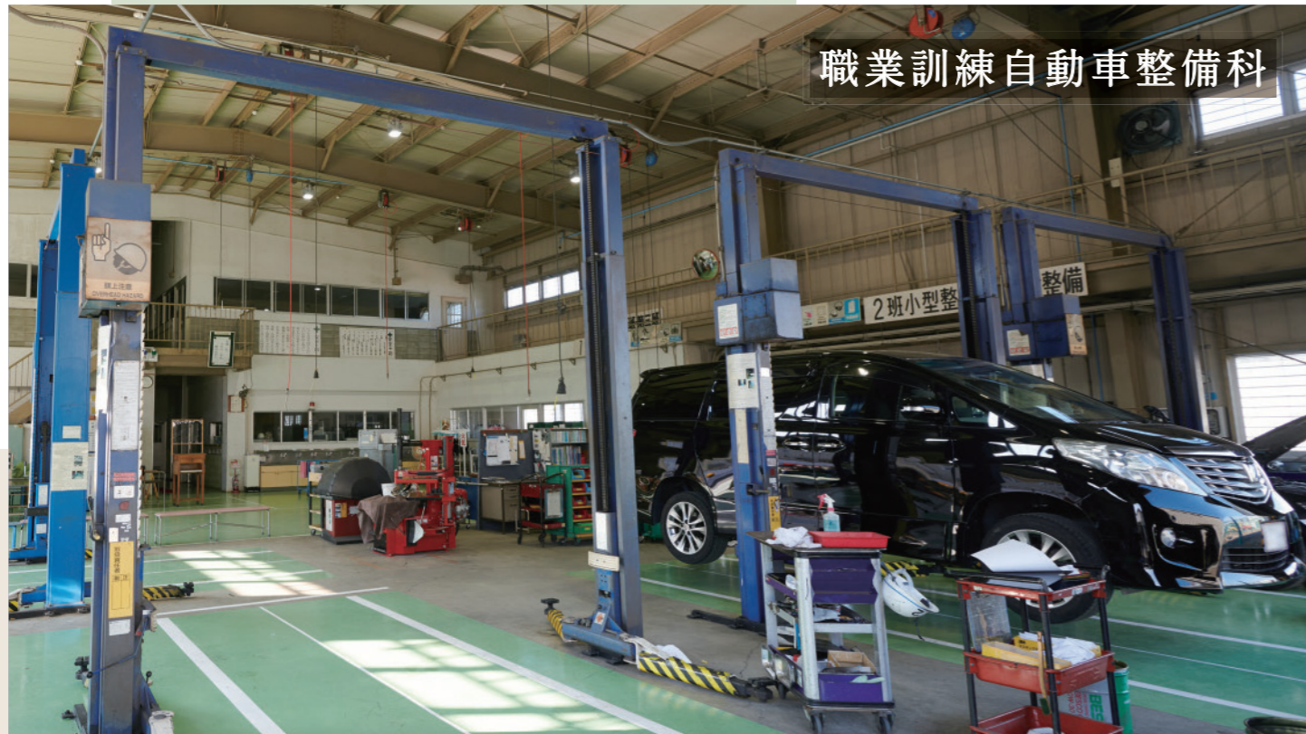
職業訓練自動車整備科