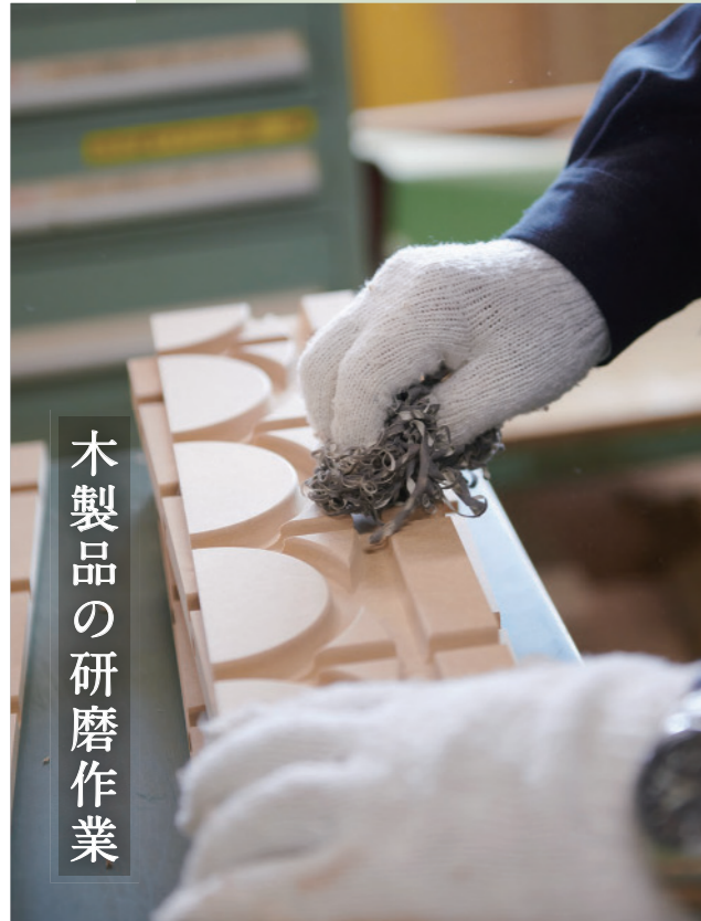
木製品の研磨作業