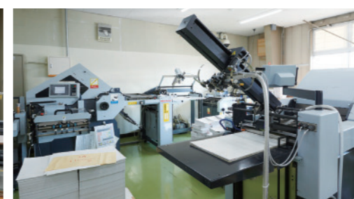
オフセット印刷機、製本機