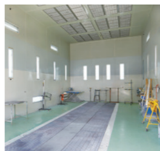
車両の塗装ブース。大型車両も塗装可能

て、自動車整備に関する知識や技能を習得させている。国家試験に合格した者は、職業訓練修了後も引き続き、刑務作業として車両の板金、塗装、車検整備等を行っている。 彼ら受刑者は、整備に預けられた自動車を一生懸命に磨き上げ、お客様にお返しする。刑務作業を通じて、仕事から得られるやりがいや責任感を学ぶことも、再犯防止に向けた受刑者処遇の目的の一つだ。