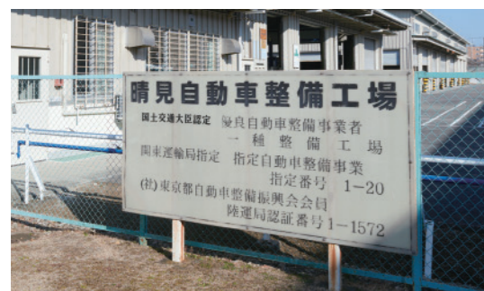
国土交通大臣認定の「晴見自動車整備工場」

て、自動車整備に関する知識や技能を習得させている。国家試験に合格した者は、職業訓練修了後も引き続き、刑務作業として車両の板金、塗装、車検整備等を行っている。 彼ら受刑者は、整備に預けられた自動車を一生懸命に磨き上げ、お客様にお返しする。刑務作業を通じて、仕事から得られるやりがいや責任感を学ぶことも、再犯防止に向けた受刑者処遇の目的の一つだ。