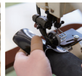
厚物対応のミシン