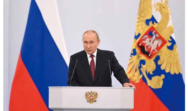
30日、ロシアのプーチン大統領が、ウクライナ東・南部4州のロシアへの「併合」を宣言