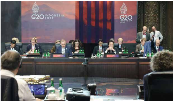
12日～19日、岸田総理は、第25回日ASEAN首脳会議(於:カンボジア)、G20首脳会合(於:インドネシア)及びAPEC首脳会議(於:タイ)にそれぞれ出席