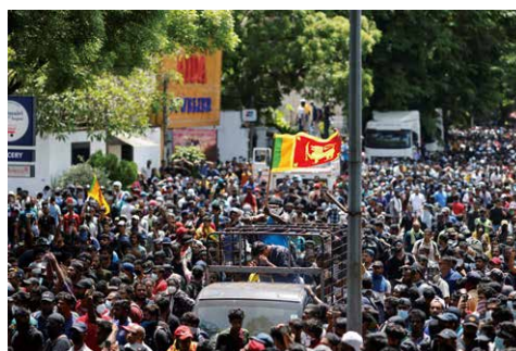
9日、スリランカで大統領等の退陣を求める大規模な抗議活動が発生