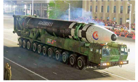
25日、北朝鮮が朝鮮人民革命軍創建90周年慶祝閱兵式を開催。新型大陸間弾道ミサイル(ICBM)などを公開