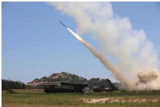
4日、中国が台湾周辺で実施した軍事演習において発射された弾道ミサイルの一部が我が国のEEZ内に落下