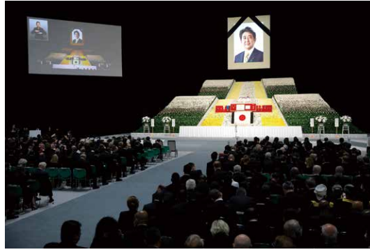
27日、参議院選挙の応援演説中に銃撃されて亡くなった安倍晋三元総理の国葬儀が日本武道館にて開催