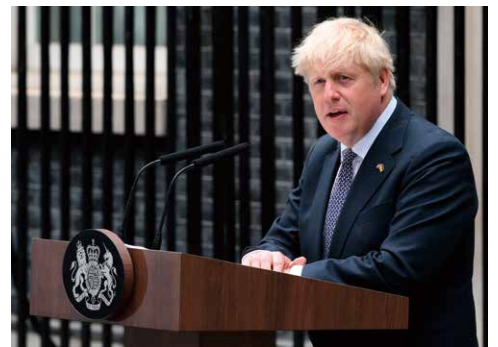
7日、英国のジョンソン首相が保守党党首の辞意を表明