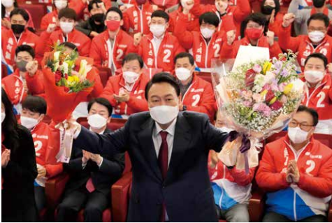
9日、韓国の大統領選挙で、尹錫悦(ユン・ソンニョル)氏が当選