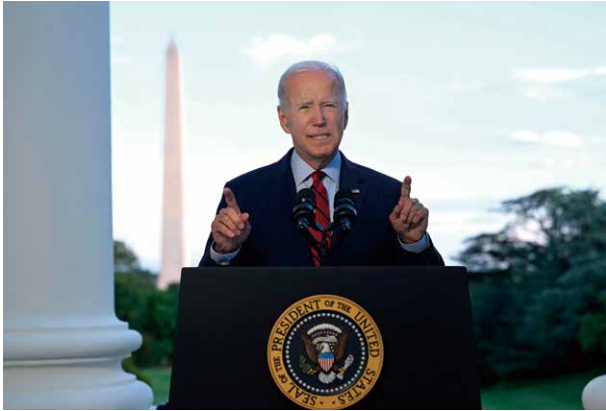
1日、米国のバイデン大統領が、「アルカイダ」最高指導者ザワヒリを空爆により殺害したと発表