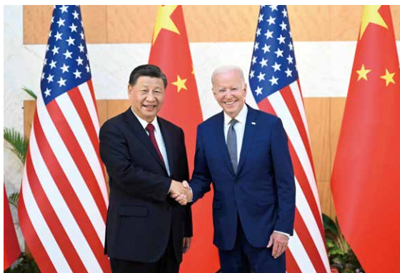
14日、バイデン大統領と習近平国家主席が、対面での会談を初めて実施