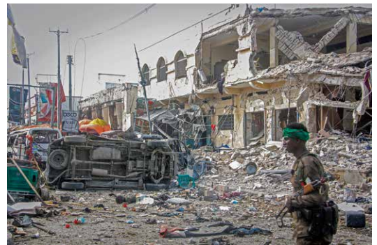
29日、アフリカのソマリアでテロが発生し、少なくとも約100人が死亡。「アルカイダ」関連組織「アル・シャバーブ」が犯行声明