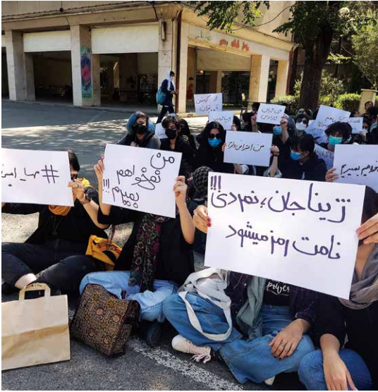
下旬、イラン各地で、髪を覆うスカーフの着用仕方が不適切だとして当局に拘束された女性の死亡に対する抗議活動が発生し、世界各地に波及