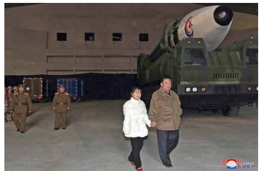
19日、北朝鮮は、報道を通じて金正恩総書記の娘とみられる少女を初公開