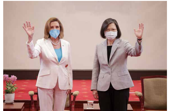
2日、米国のペロシ下院議長が台湾を訪問し、蔡英文総統と会談