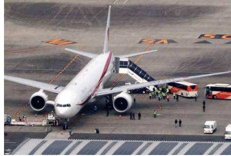
5日、ウクライナからの避難民を乗せてポーランドから出発した政府専用機が羽田空港に到着