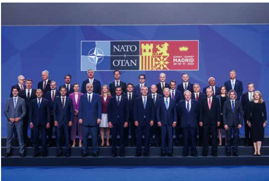
29日、北大西洋条約機構(NATO)は、首脳会合で、フィンランド及びスウェーデンの加盟に合意