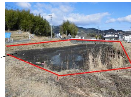
表題部所有者不明土地が解消された土地（ため池）