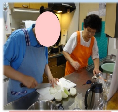
社会復帰支援指導