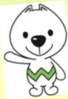
和歌山県PRキャラクター 「きいちゃん」

また、7月14日(金)(午前11時～午後1時)は、和歌山県庁本館2階県民ロビーで、和歌山刑務所の作業製品が展示・販売される「和歌山県庁矯正展(刑務所作業製品展示・即売会)」も開催されます。