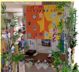
令和4年のゆうゆうセンターでの飾りつけ

また、交野女子学院はデザイン画のほか、飾りのパーツも製作、にぎやかな飾りつけをご覧ください。