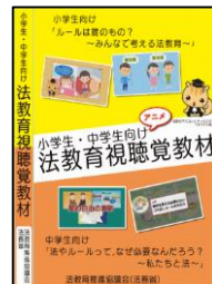
小・中学生向け視聴覚教材