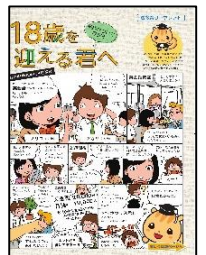
高校生向けリーフレット