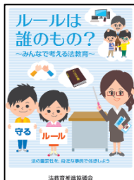
小学生向け冊子教材