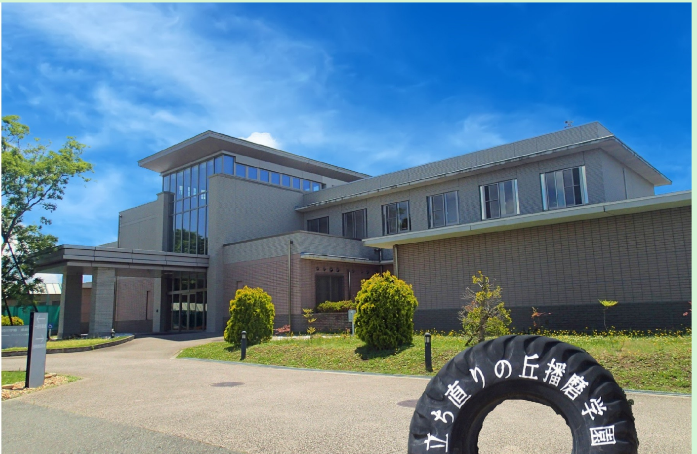
写真 加古川学園・播磨学園庁舎

タイトルの「Adapt」は適応するという意味です。就職など一つ上のステージに上がると、困難なこともあります。新しい環境にAdaptして自分自身を高めてほしいという思いを込めています。