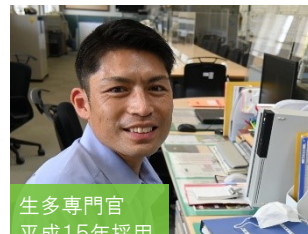
生多専門官 平成15年採用 管理主任