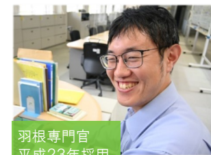
羽根専門官 平成23年採用 教務主任