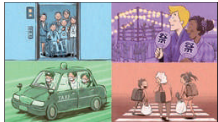
啓発動画「『誰か』のこと じゃない。 一 支え合う共生社会の実現に向けて」