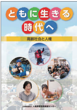
啓発冊子 「とも生きる時代へ 高齢社会と人権」

そのほか、高齢者と身近に接する機会の多い社会福祉事業従事者等に対して、人権相談活動について周知・説明し、人権侵害事案を認知した場合の情報提供を呼び掛けるなど連携を図っています。