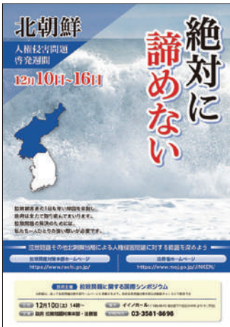
ポスター「北朝鮮人権侵害問題啓発週間」

同週間中、政府主催国際シンポジウムを始めとする様々なイベントの開催や、電車内の中吊り広告やインターネット広告、新聞広告等の各種メディアによる周知・広報などの様々な活動が行われています。