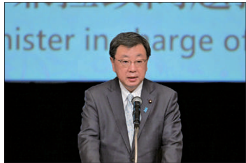
政府主催国際シンポジウム