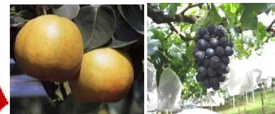
特産品の梨とぶどう