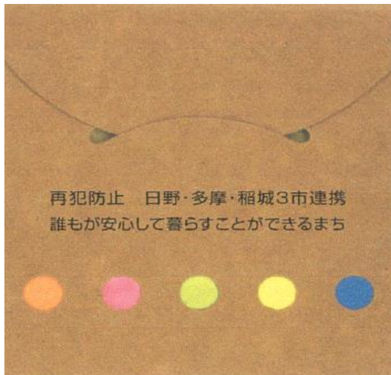
啓発グッズ（付せん）