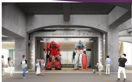
ガンダム&シャアザク