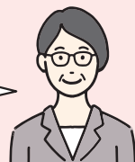
更生保護女性会員

たとえば、地域の人たちに更生保護の心を伝えるミニ集会や、子育てに悩むお母さんたちを集めての子育て支援教室、地域の子どもたちと一緒に非行防止活動といった活動もありますよ。