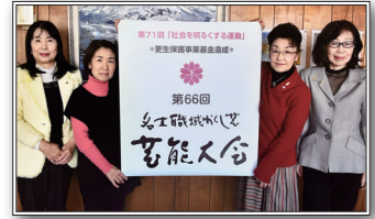
名士職域かくし芸芸能大会にて

A 毎年、“社会を明るくする運動”の一環として、当会主催で「名士職域かくし芸芸能大会」を実施しています。当日は、子供たちのミュージカルや日本太鼓演奏等の出し物で大いに賑わいます。保護観察所、保護司会、BBS会を始め、市内の多くの団体の御協力の下、開催することができ、人と人が繋がることの大切さを再認識することができる活動です。