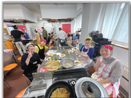
グループワークの一環でお好み焼き作りをする様子

A ともだち活動はもちろんですが、グループワークと自己研鑽に注力しています。ここ数年のグループワークでは、バーベキュー、横浜の街散策、ビーチボールバレー、お好み焼き作りを実施しました。グループワークに少年が参加してくれたことがきっかけで、ともだち活動が始まったケースもあり、継続的に少年と関わる機会を作り続けることが重要だと考えています。ともだち活動は、年間数名の少年を途切れることなく担当しており、毎月開催している定例会の中で進捗を報告し、会員や保護司の方から様々な角度でアドバイスをもらい、定例会が研鑽活動の場にもなっています。また、新たな活動として、神奈川県内の児童家庭支援センターへの訪問活動を開始し、地域に根ざした活動も行っています。