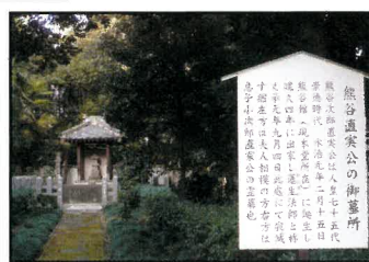
▲熊谷直実公の御墓所