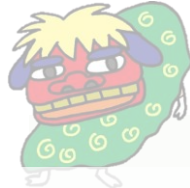
出張コレワーク会場