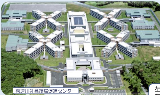
喜連川社会復帰促進センター